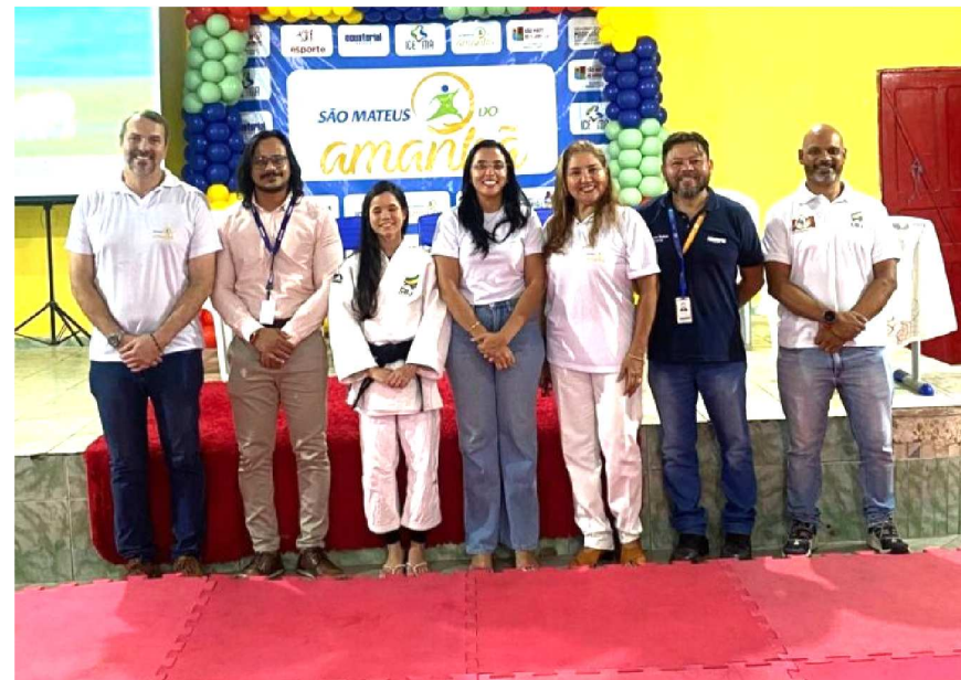
Além das práticas esportivas, o "São Mateus do Amanhã" também promove ações de convivência e cidadania, fortalecendo vínculos comunitários e contribuindo para a formação de uma geração mais consciente, confiante e participativa