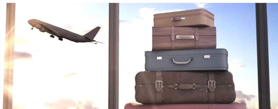
MEDIDAS VALEM PARA VOOS DOMÉSTICOS OU INTERNACIONAIS OPERADOS NO BRASIL