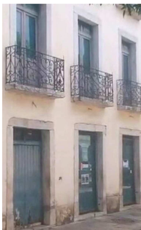
Antigo prédio da Defensoria Pública – Centro histórico

O Festival Sons da Ilha se estabelece, assim, como um ponto de encontro singular entre tradição e modernidade, impulsionando a música, a inclusão social e o desenvolvimento do protagonismo juvenil em São Luís.