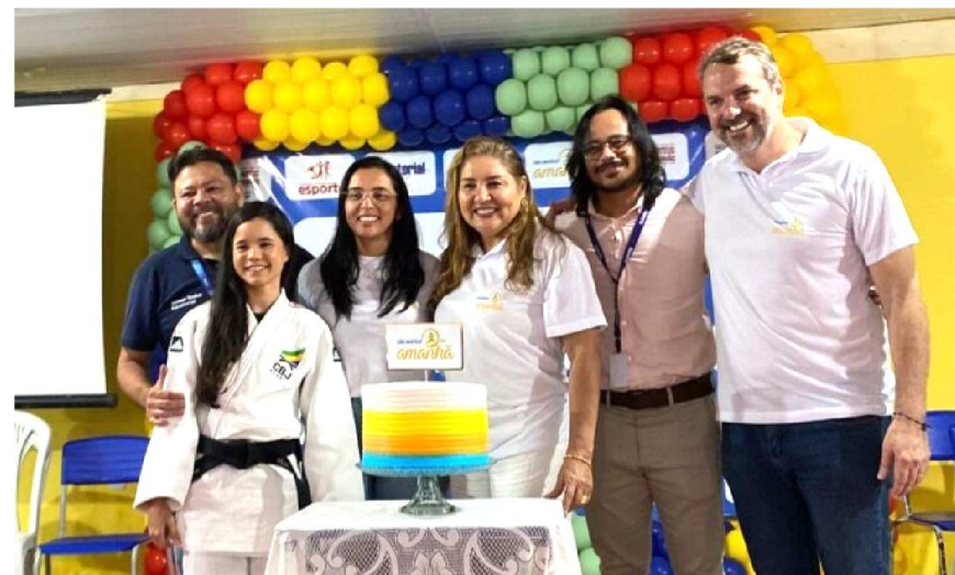
Por meio da Lei Estadual de Incentivo ao Esporte, a empresa tem possibilitado a realização de diversos projetos voltados à inclusão social de crianças e jovens em situação de vulnerabilidade, ampliando o acesso ao esporte e à educação em várias regiões do estado.