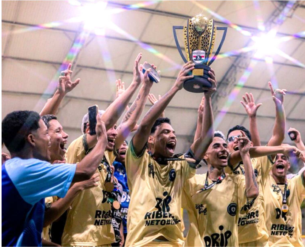
ATLÉTICO OPERÁRIA CONQUISTOU A LIGA MARANHENSE 2025 NO GINÁSIO DO TIÃO

Agora o Atlético Operária tem pela frente o Campeonato Maranhense 2025 e o 14º Circuito de Futsal Newinfor, em Barreirinhas, entre os dias 13 e 16 de novembro. A competição será transmitida pela TV Dunas.