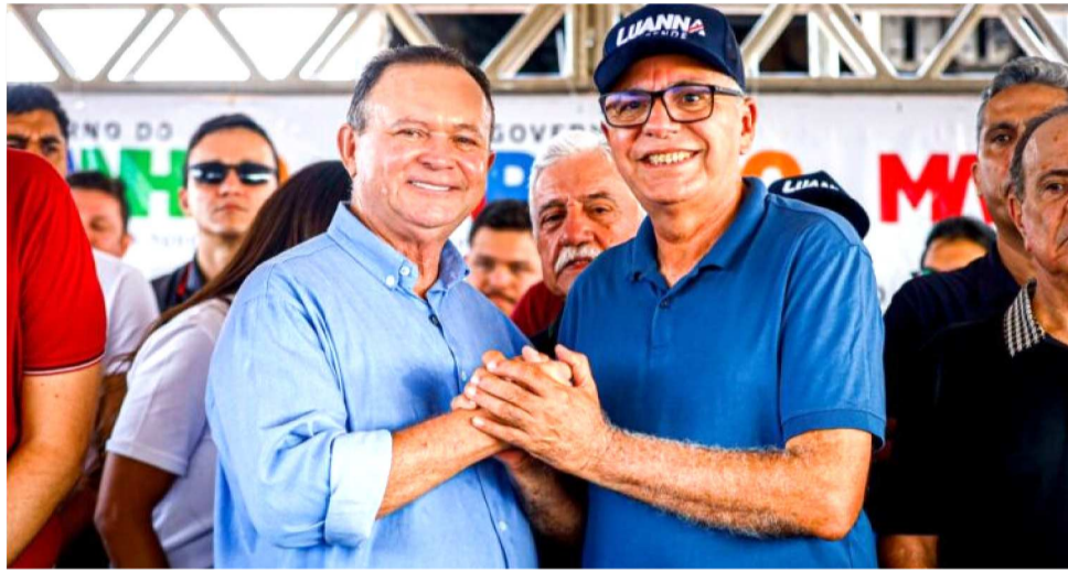
“ESSA ERA UMA DEMANDA ANTIGA, HISTÓRICA, DA POPULAÇÃO”, DISSE O GOVERNADOR

“Seguimos com a nossa agenda municipalista. Essa era uma demanda antiga, histórica, da população, pois