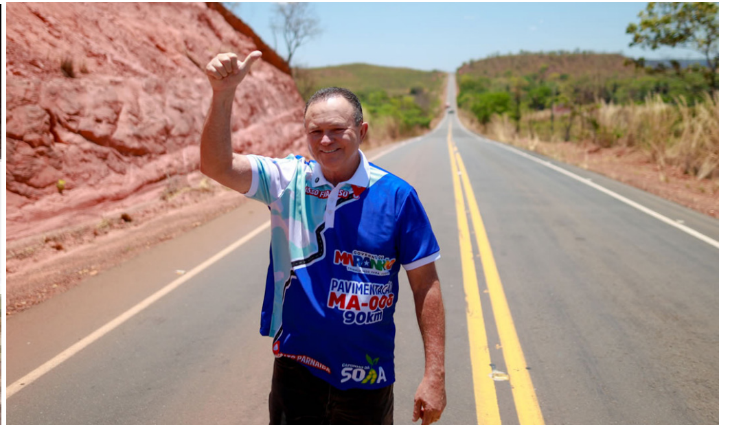
Brandão entrega 90km de requalificação da MA-006, ligando Tasso Fragoso a Alto Parnaíba