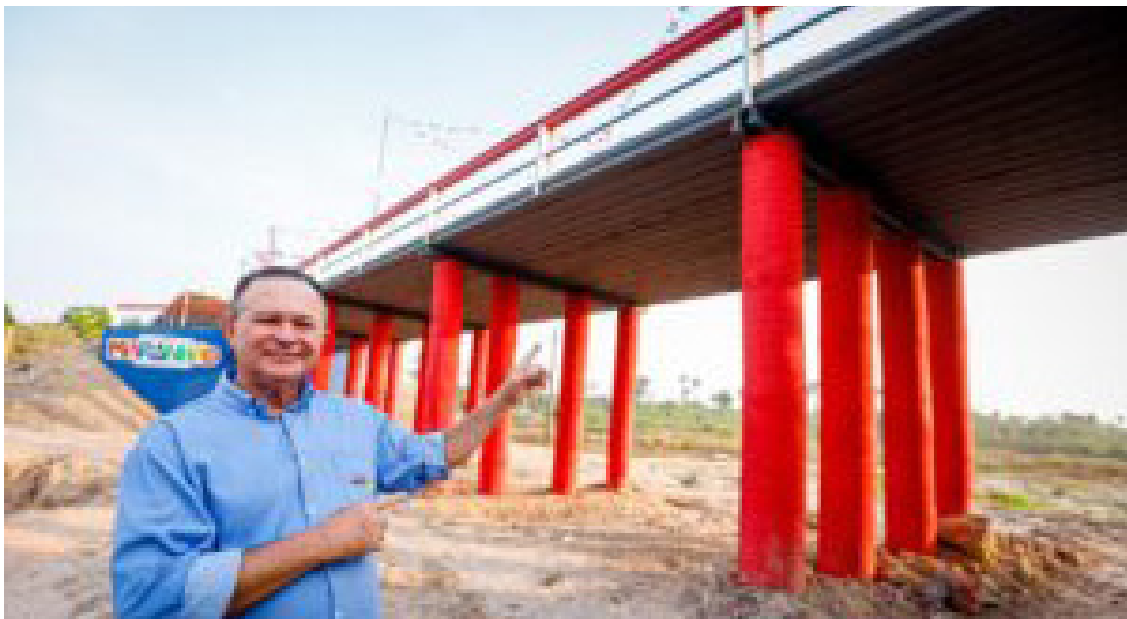
Estado inaugura três pontes em Vitorino Freire obra garante mobilidade, especialmente no período chuvoso

Os municípios brasileiros e do Maranhão tiveram sua nova radiografia administrativa, econômica e social atualizada pelo Instituto Brasileiro de Geografia e Estatística (IBGE). Os dados revelam um cenário misto: enquanto há avanços em áreas como transparência e digitalização de serviços, persistem lacunas em políticas estruturantes. O levantamento indica que 67 municípios disponibilizam Wi-Fi gratuito, 194 publicam informações orçamentárias no Portal da Transparência, e 214 (98,6%) possuem site institucional. Mais do que números, o levantamento do IBGE traduz o retrato que emerge é o de um estado em movimento, com esforços visíveis de modernização, mas ainda com desafios na construção de políticas públicas duradouras e inclusivas.