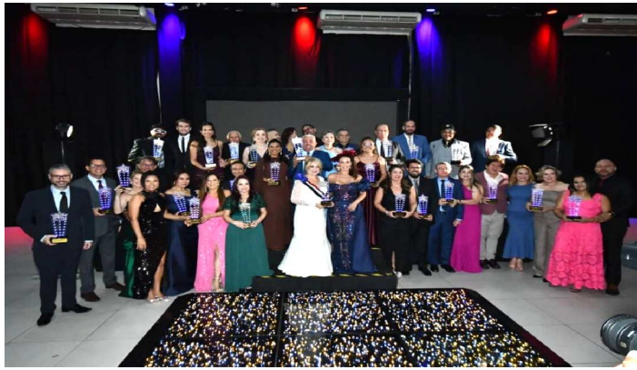
TODOS HOMENAGEADOS DO PRÊMIO NOBRE 2025