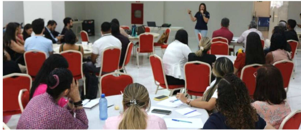
OBJETIVO DA REUNIÃO TÉCNICA FOI PROMOVER INTEGRAÇÃO PARA FISCALIZAÇÃO

A programação incluiu palestras sobre os aspectos legais da produção de bebidas e sua comercialização, ações de vigilância sanitária na prevenção de intoxicação por metanol em bebidas alcoólicas e a importância da orientação para consumidores e fornecedores sobre o consumo de be-