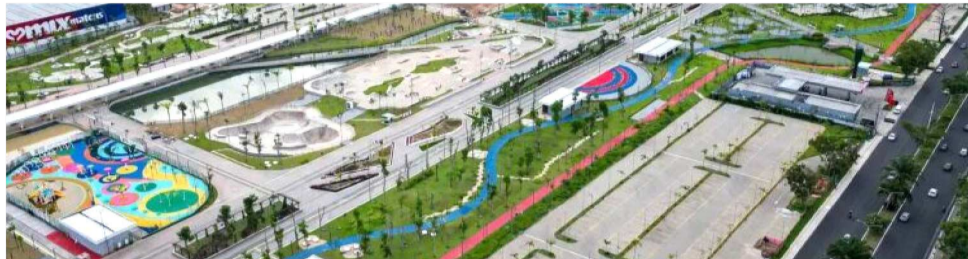
PAVILHÃO CENTRAL DO PARQUE DA CIDADE REÚNE PESSOAS DE DIVERSAS NAÇÕES

Em ponto da fila de acesso à Zona Verde a conversa de babel predomina. A distinção no figurino denota nacionalidade, mas a predominância é de brasileiros, nativos do norte brasileiro. Já no acesso à zona azul, alguns trajam terno sem gravata (o máximo de informalidade que alcançam) e pelos traços fisionômicos a hegemonia de latinos americanos é percebido.