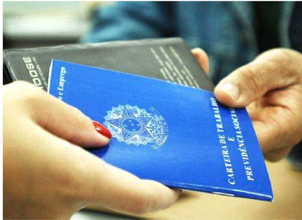
COMÉRCIO MARANHENSE DEVE ABRIR MUITAS VAGAS TEMPORÁRIAS NO FIM DE 2025