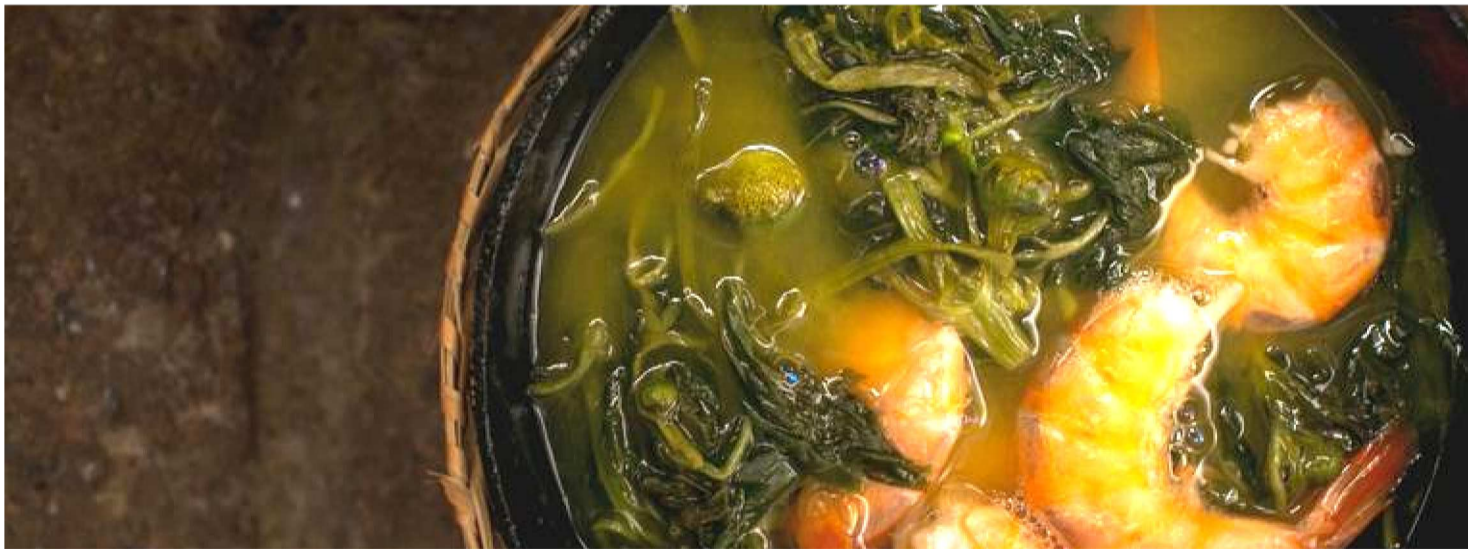
COM VOZES EM VÁRIAS LÍNGUAS E OLHARES VOLTADOS À FLORESTA, BELÉM RECEBE A COP 30 E VÊ SUA ROTINA DIÁRIA MUDADA