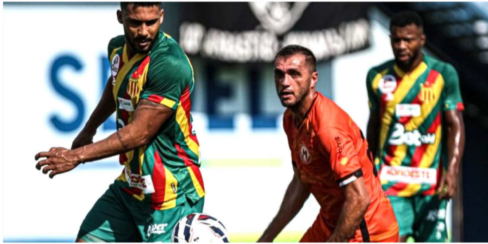
O SAMPAIO CORRÊA AINDA NÃO DIVULGOU O INÍCIO DA PRÉ-TEMPORADA

A tendência é que o técnico venha de outro estado, o mesmo ocorrendo com a grande maioria dos integrantes do grupo que vai começar a pré-temporada. O clube vai manter a mesma prática adotada nos últimos anos de só divulgar os nomes dos novos reforços quando estes já tiverem assinado os contratos. A chegada do novo grupo deverá ocorrer ainda neste mês de novembro, pois a apresentação acontecerá nos primeiros dias de dezembro, quando também serão iniciados os treinamentos. Esta é a previsão da