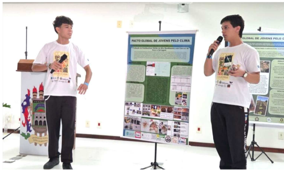
PROJETOS DE ESTUDANTES DAS UNIDADES DE CODÓ E TUTÓIA FORAM APRESENTADOS