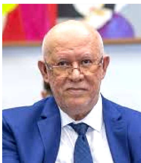
Na manhã da operação, foram