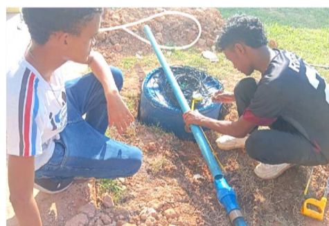
IEMA Pleno Tutóia: Combustível ecológico feito a partir de resíduos

O segundo projeto que representará o Maranhão na COP30 é o “Produção de combustível sólido de alto rendimento com cascas de coco e serragem”, do IEMA Pleno Tutóia. A iniciativa transforma resíduos — como cascas de coco, largamente descartadas no litoral da região — em um combustível sólido eficiente e sustentável.