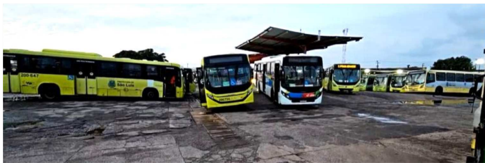
TRANSPORTE PÚBLICO NA GRANDE ILHA ENFRENTA SEU QUINTO DIA DE PARALISAÇÃO

nova paralisação do sistema de transporte público é grave e destaca que eventual inadimplemento das verbas determinadas em liminar pode representar “esvaziamento completo da eficácia e do propósito da decisão judicial”. O Desembargador ressalta que a ordem liminar possui eficácia normativa e vincula todos os integrantes das categorias representadas no dissídio.