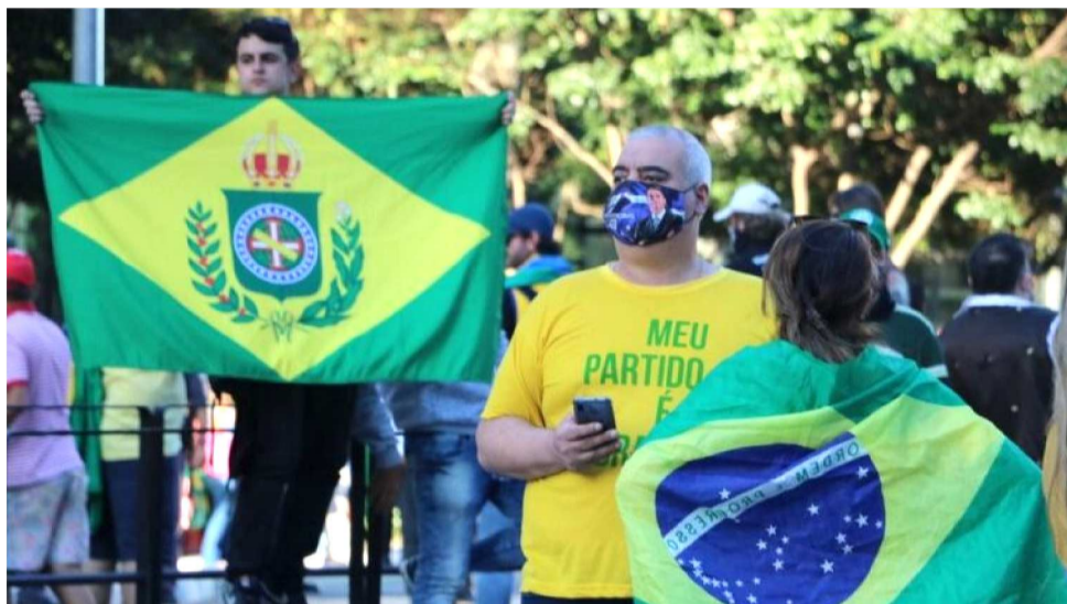
BANDEIRA FOI INSPIRADA NA BANDEIRA DO IMPÉRIO, DESENHADA POR PINTOR FRANCÊS

Apesar de muitas pessoas associarem a bandeira à virada política de 1889, ela só foi oficialmente instituída dias depois. O decreto que criou o novo símbolo nacional foi assinado em 19 de novembro, substituindo o estandarte imperial.