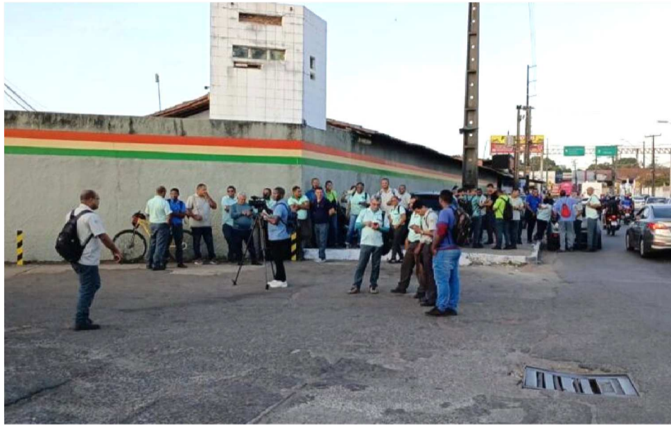
PARALISAÇÃO DEIXOU PASSAGEIROS DE MAIS DE 30 BAIRROS SEM TRANSPORTE