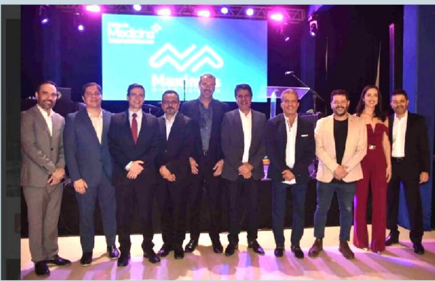
Grupo de Parceiros da DOM e HRO