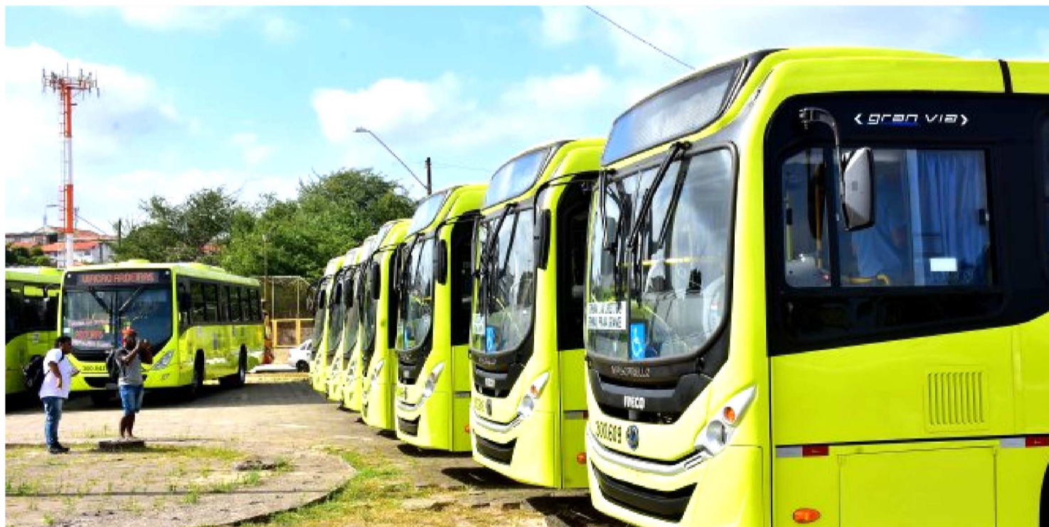
INICIATIVA BUSCA ACELERAR A NORMALIZAÇÃO DO TRANSPORTE SEMIURBANO PARALISADO NA GRANDE ILHA DE SÃO LUÍS

A Agência Estadual de Mobilidade Urbana e Serviços Públicos (MOB) realizou nesta terça-feira, uma reunião com os empresários do transporte semiurbano, representantes do Sindicato dos Trabalhadores em Transportes Rodoviários no Estado do Maranhão (STTREMA) e do Sindicato das Empresas de Transporte de Passageiros do Maranhão (SET), na sede da Agência. O encontro teve como objetivo tratar da greve dos rodoviários, que atualmente envolve as empresas 1001 e Marina.