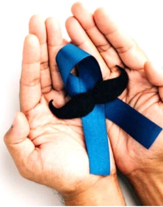
CERCA DE 75% DOS CASOS OCORREM EM IDOSOS COM MAIS DE 65 ANOS

A maior incidência é esperada na região Sudeste (77,9 casos por 100 mil homens), seguida do Nordeste (73,3), Centro-Oeste (61,6), Sul (57,2) e Norte (28,4). No entanto, as taxas de mortalidade são maiores no Norte e Nordeste, demonstrando um diagnóstico mais tardio nessas regiões. Segundo dados do Instituto Nacional de Câncer (INCA), o Brasil registrou 17.258 óbitos por câncer de próstata em 2023 e 17.587 em 2024, representando um aumento de aproximadamente 2%. O Maranhão concentra 401 dos 4.881 óbitos por câncer de próstata registra-