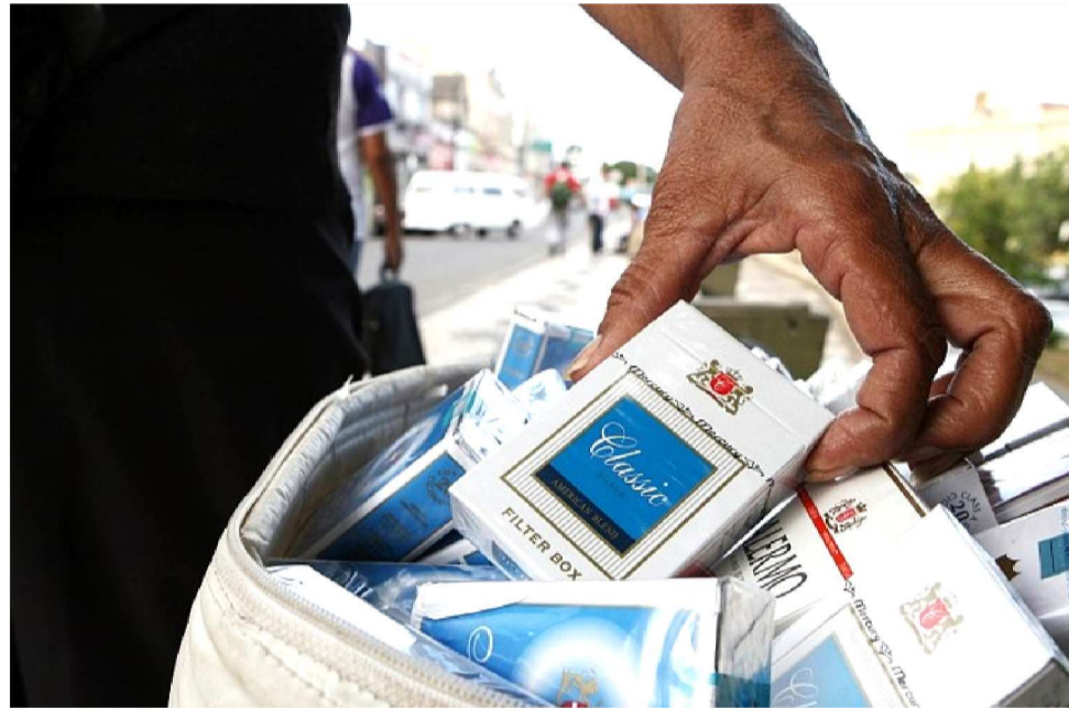
O LEVANTAMENTO MOSTRA QUE COMÉRCIO ILEGAL MOVIMENTOU R$ 356 MILHÕES

No conjunto do Nordeste, o problema também é grave: a região concentra a maior participação regional de cigarros piratas do Brasil — 43% do mercado regional contra uma média nacional de 32%. Entre os estados mais afetados, além do Maranhão, estão Piauí e Rio Grande do Norte, ambos com índices na casa dos 60%.