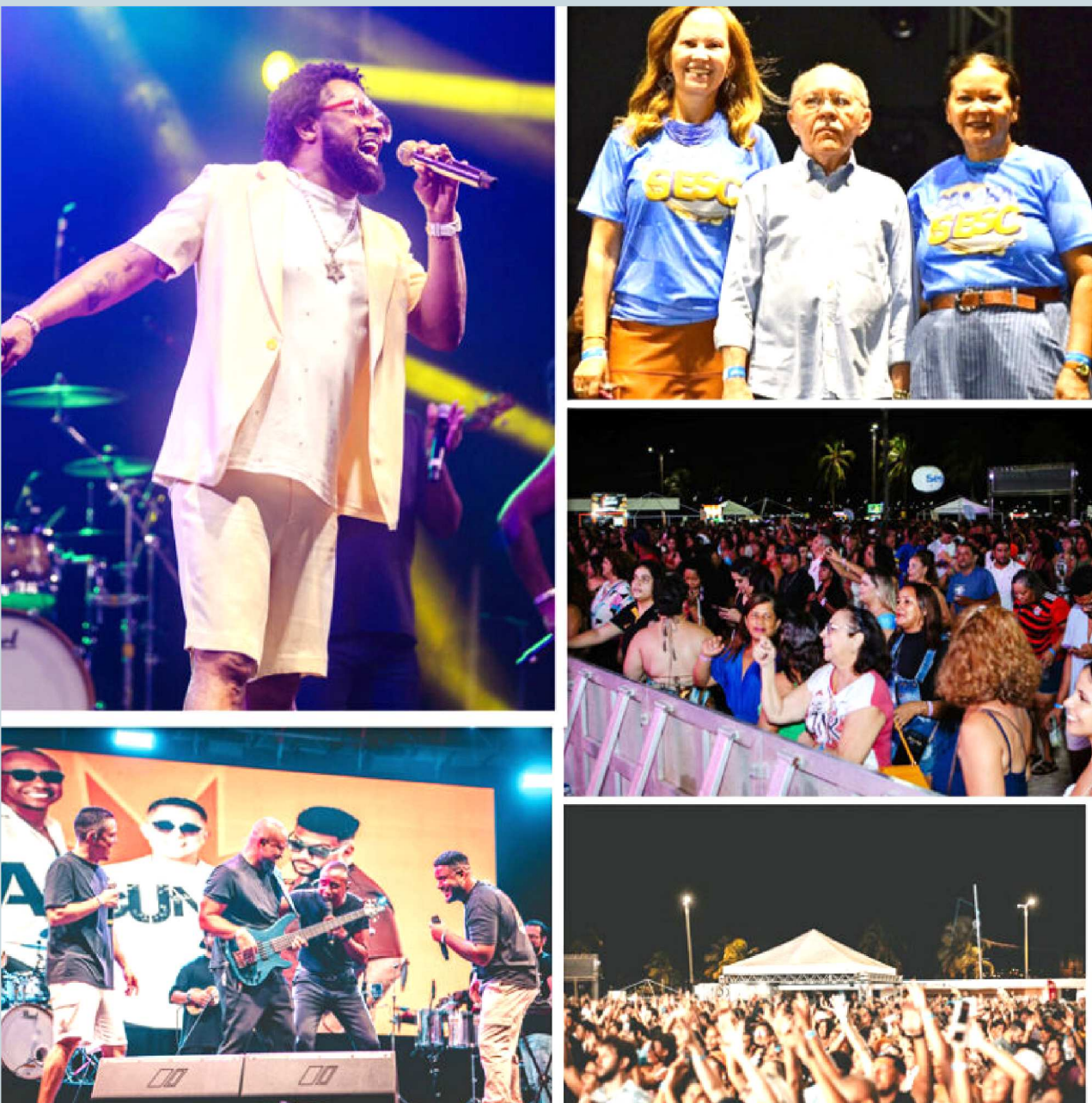
Além do impacto na arrecadação de alimentos, o “Samba Sesc” reuniu mais de 8 mil pessoas no Centro Histórico de São Luís - potencializando toda a cadeia econômica da região e gerando renda e oportunidades para centenas de maranhenses.