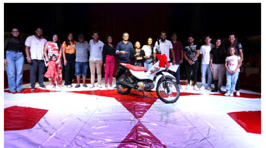
Equipe Maxx com a vencedora