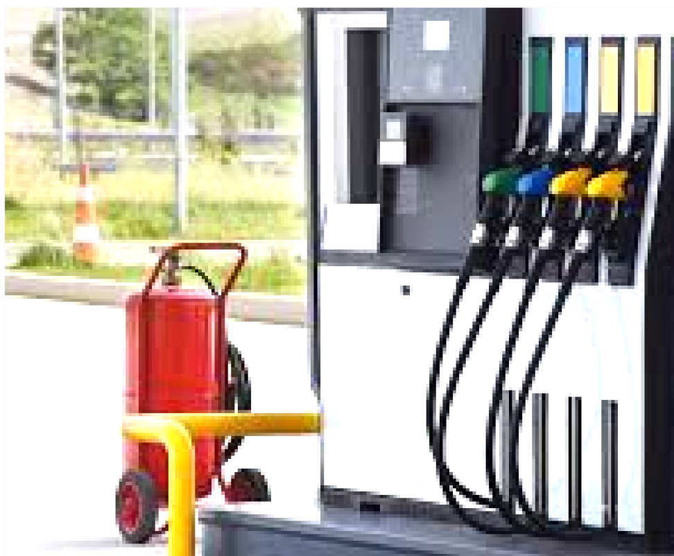
O AUMENTO NO DIESEL SERÁ DE R$ 0,05 POR LITRO, SENDO COBRADO R$ 1,17 DE IMPOSTO

A alteração no preço, de acordo com o Comitê Nacional de Secretários de Fazenda, Finanças, Receita ou Tributação dos Estados e do Distrito Federal (Comsefaz), considera os preços médios mensais dos combustíveis divulgados pela Agência Nacional do Petróleo, Gás Natural e Biocombustíveis (ANP), no período de fevereiro a agosto de 2025, em comparação ao mesmo período de 2024.