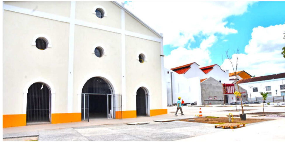
OBRAS COMPLEXO TRAPICHEA RECEBEU INVESTIMENTO DE MAIS DE R$ 60 MILHÕES