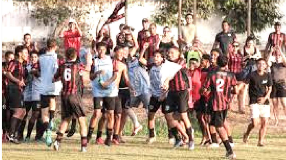
O MOTO CLUB, ALÉM DO CAMPEONATO ESTADUAL, VAI DISPUTAR O BRASILEIRO EM 2026

A diretoria do Moto acredita que agora, com o calendário definido (Estadual e Brasileiro), abre-se a oportunidade para contratação de jogadores de melhor qualidade técnica, pois facilita o convencimento de profissionais que, desta forma, ficam sabendo que terão pelo menos seis meses de contrato com o Papão. Nas próximas