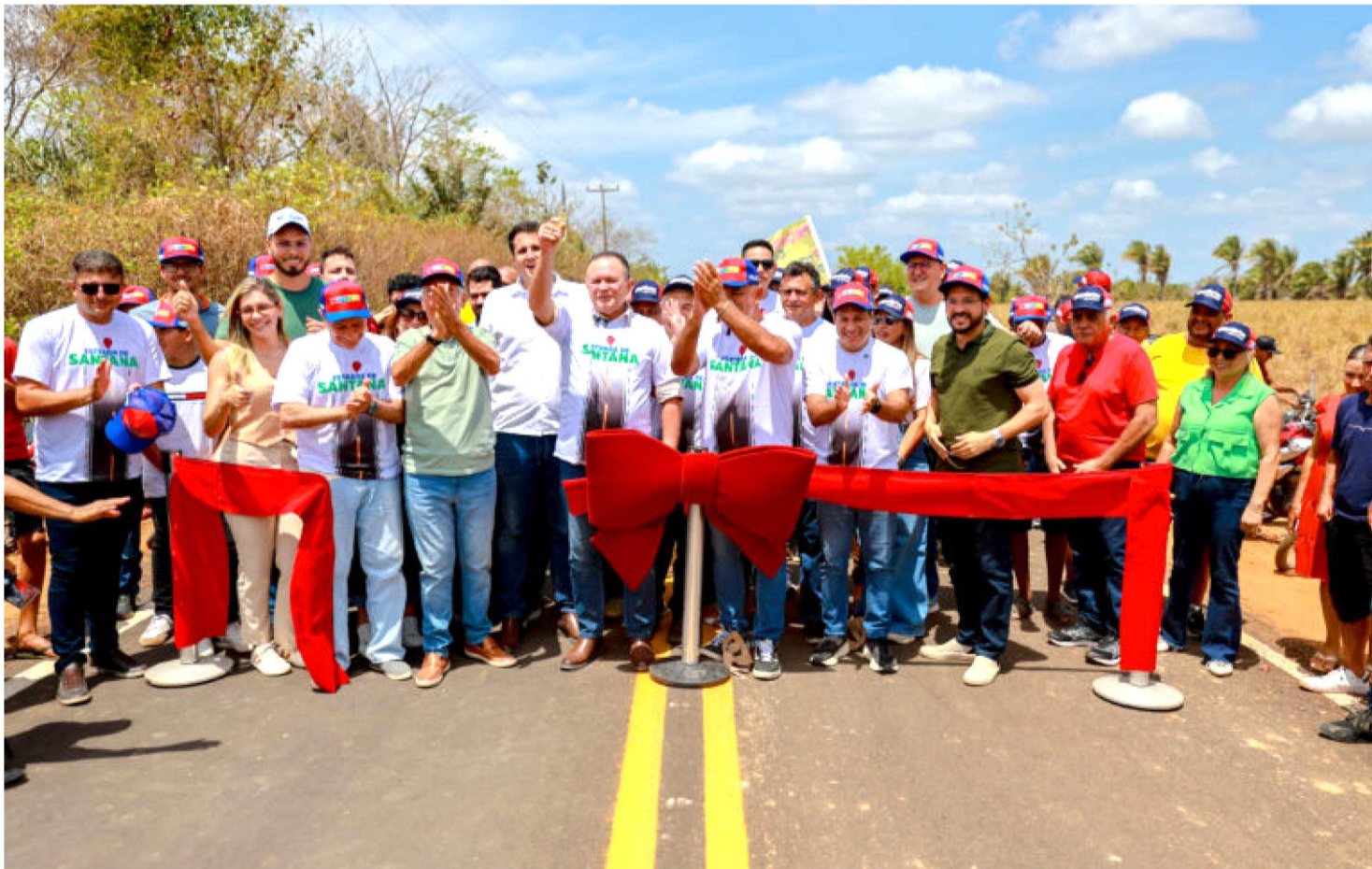
GOVERNADOR MARANHENSE RESSALTOU QUE A PROPOSTA DA OBRA É REDUZIR EM ATÉ TRÊS HORAS O ACESSO À BAIXADA

O governador Carlos Brandão também vistoriou o andamento de outras obras cruciais na região, como a Travessia da Baixada.