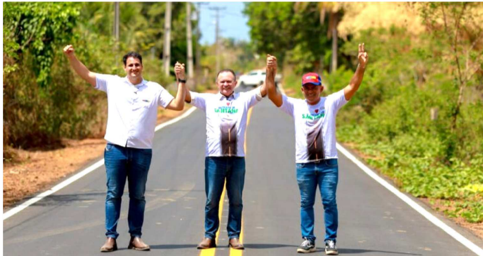
COM MAIS DE 15 KM, A ESTRADA RECEBEU UM INVESTIMENTO DE R$ 29,8 MILHÕES

A obra, executada pela Secretaria de Estado da Infraestrutura (Sinfra), incluiu serviços de terraplanagem, instalação de base e sub-base, construção de bueiros e toda a parte de drenagem para garantir o escoamento da água da chuva. A pavimentação foi finalizada com asfalto de alta qualidade (CBUQ), o que aumenta a durabilidade da via e melhora o desem-