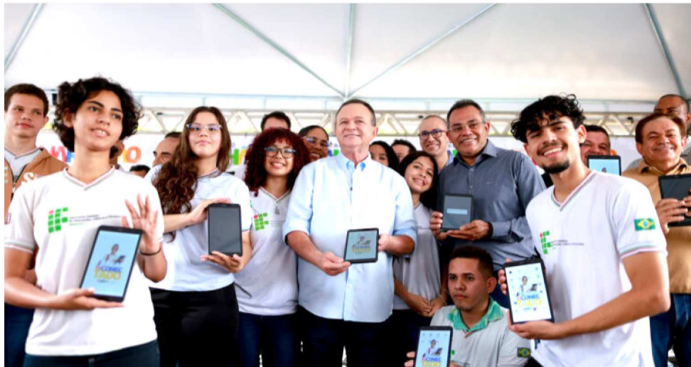
ESTADO ENTREGOU MAIS DE 900 EQUIPAMENTOS PARA OS ALUNOS EM IMPERATRIZ

“Fizemos um estudo técnico e ampliamos o programa para entregar mais de 15 mil tablets para os alunos do Ifma, para que eles possam ter as