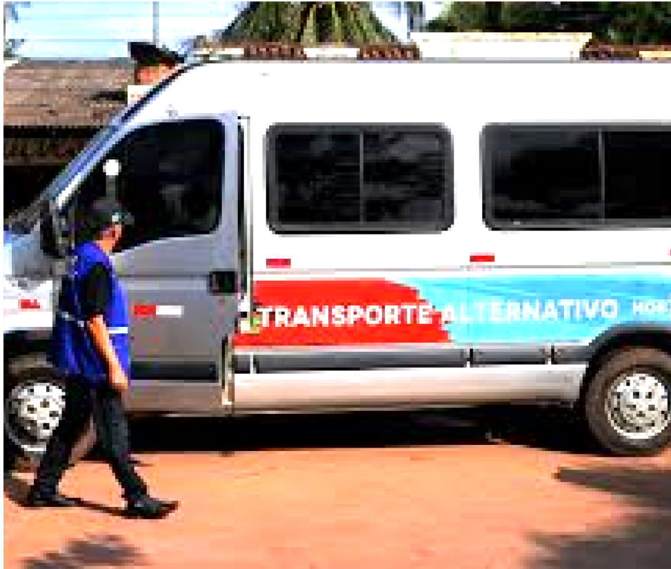
INICIATIVA PODE SER EXPANDIDA DE FORMA GRADUAL PARA CIDADES COMO IMPERATRIZ

A iniciativa de redução tarifária está começando na Grande Ilha e, de forma gradual, o programa de subsídio e consequente redução da tarifa será expandido para outras regiões do