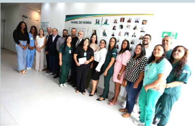
Diretores e colaboradores celebrando as conquistas dos 14 anos do HSLZ junto ao Painel de Honra.