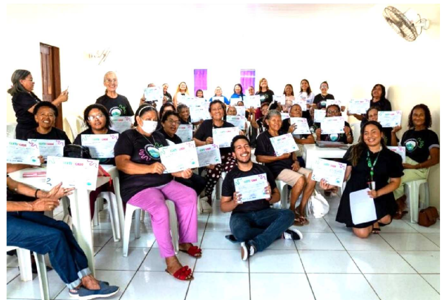
Projeto Reaprendendo o Mundo, de educação digital para pessoas idosas, em São Luís.

O Instituto Equatorial reforça que estão nos últimos dias de inscrições para a segunda edição do Edital Diálogos Equatorial, que se encerram nesta quinta-feira, dia 18 de dezembro. Com investimento total de R$ 4 milhões, a iniciativa amplia o apoio a projetos sociais nos sete estados de atuação do Grupo Equatorial: Maranhão, Pará, Piauí, Alagoas, Amapá, Goiás e em 72 municípios do Rio Grande do Sul. Podem participar do edital as Organizações da Sociedade Civil (OSC) legalmente constituídas há pelo menos dois anos e com atividades comprovadas no mesmo período. Projetos voltados à economia criativa e ações territoriais receberão pontuações extras no processo de seleção. Nesta edição, serão apoiadas propostas nos valores de R$ 20 mil até R$ 50 mil, voltadas especialmente para iniciativas de base comunitária, dando continuidade a uma trajetória de transformação social comprovada.