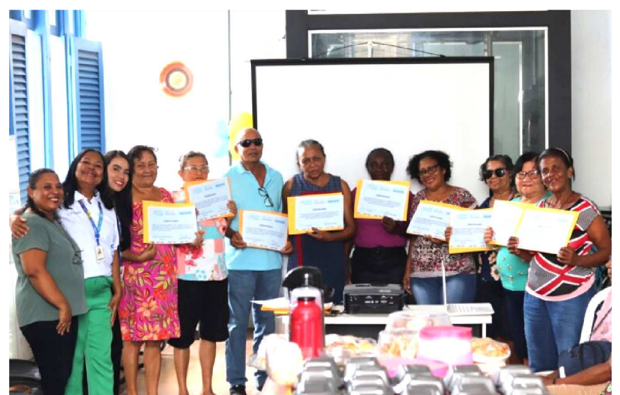
Projeto Semeando Sabores.