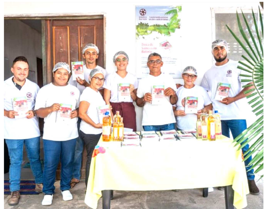
Projeto Babaçu - Boa Vista, Alto Alegre do Pindaré.