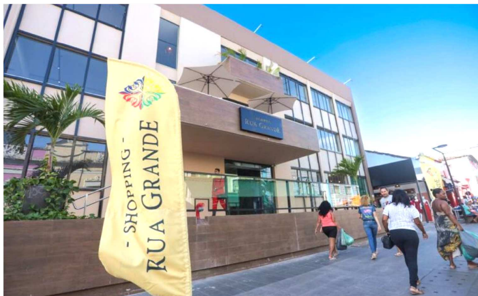
A MOVIMENTAÇÃO FINANCEIRA DO PERÍODO DEVE ATINGIR R$ 176 MILHÕES

Segundo a Pesquisa de Intenção de Consumo para o Natal 2025, realizada pela Federação do Comércio de Bens, Serviços e Turismo do Estado do Maranhão (Fecomércio-MA), cerca de 56,2% dos consumidores ludovicenses pretendem comprar presentes neste fim de ano, o que representa aproximadamente 445 mil pessoas. A movimentação financeira do período deve atingir R$ 176 milhões, um crescimento nominal de 6% em relação a 2024 e ganho real de 1,4% após considerar a inflação. “O aumento do número de consumidores que irão às