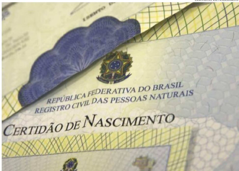
AO TODO, 682 CRIANÇAS FORAM REGISTRADAS COM O NOME NO ESTADO DO MARANHÃO

O levantamento integra a base do Portal da Transparência do Registro Civil, administrado pela Arpen-Brasil, entidade que congrega os Cartórios de Registro Civil do país e reúne informações sobre nascimentos, casamentos e óbitos registrados em todo o território nacional. A plataforma permite consultas por nomes simples ou com-