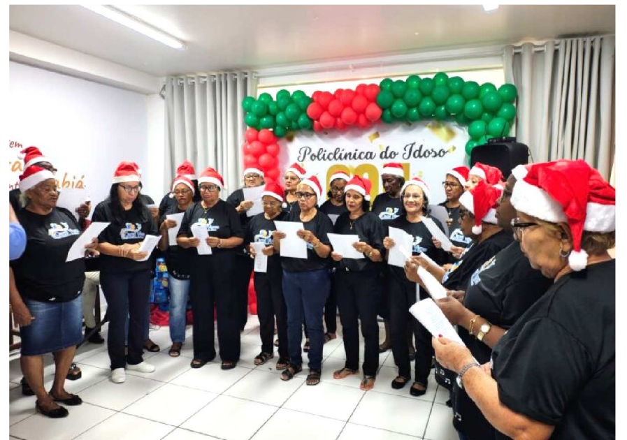
Além das atividades musicais, como o Coral Vozes Poli do Idoso, a unidade promove ações socioeducativas, oficinas de arteterapia, grupos terapêuticos e torneios cognitivos