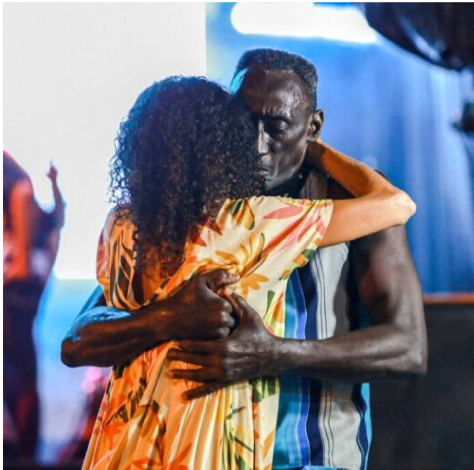
APÓS VÁRIAS EDIÇÕES, CHEGA AO FIM NESTA TERÇA-FEIRA (23)