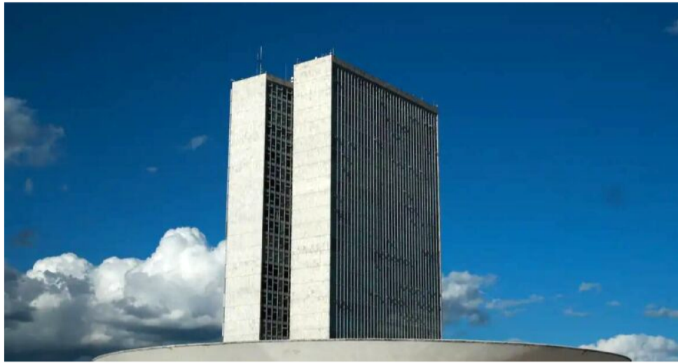
EX-PARLAMENTARES TAMBÉM PERDERAM BENEFÍCIOS COMO IMÓVEL FUNCIONAL

Em fevereiro, Eduardo viajou para os Estados Unidos, onde ajudou a promover o tarifaço contra as expor-