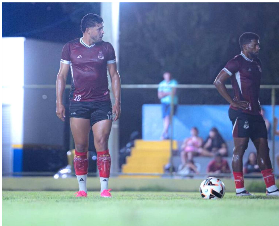
NAS DUAS PARTIDAS, O CAVALOS DE AÇO TEVE DUAS VITÓRIAS COM 6 GOLS MARCADOS

A entrada será 1kg de alimento não perecível. Uma quarta partida será realizada em solo paraense, mas sem data e nem horário previsto.