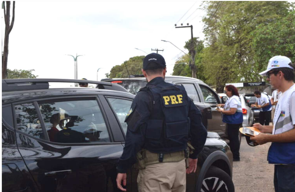
DE JANEIRO A AGOSTO DE DESTE ANO, A PRF REGISTROU 691 SINISTROS NAS RODOVIAS

Quem precisa pegar a estrada deve sempre ficar atento às normas de segurança de trânsito, condições dos automóveis, e a própria segurança pessoal, mas neste final de ano, por conta de recesso, férias escolares, ou do feriado de carnaval, essa atenção deve ser redobrada em razão do alto fluxo de veículos nesse período. Para aumentar essa segurança, a Polícia Rodoviária Federal intensificará a fiscalização nas rodovias até o dia 22 de fevereiro, em mais uma edição do Programa Rodovia. Considerando o histórico de movimentação de pessoas no país, o perfil do trânsito nas rodovias federais será caracterizado pelo aumento do fluxo de veículos e de passageiros, em função das férias escolares e das festividades alusivas ao Natal, ao Réveillon e ao Carnaval. O principal objetivo da operação é fiscalizar e reduzir a violência no trânsito, conscienti-