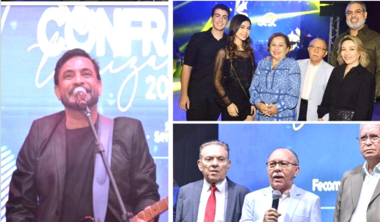
Com a presença de mais de 1.000 pessoas, o encontro foi marcado pela celebração das conquistas alcançadas ao longo do ano. O cantor PP Junior aninou o evento