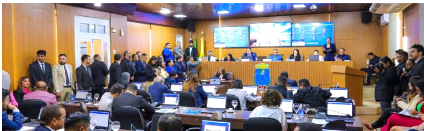
OS DADOS FORAM COMPILADOS ATÉ O DIA 18 DE DEZEMBRO DE 2024, ÚLTIMA SESSÃO ORDINÁRIA DO ANO DA CÂMARA DE SÃO LUÍS

A 20ª legislatura da Câmara Municipal de São Luís, que compreendeu os anos de 2021 a 2024, encerrou suas atividades com um balanço histórico: 1.601 normativos aprovados entre Projetos de Lei (PLs), Decretos Legislativos (DLs), Projetos de Resolução (PRs), Emendas à Lei Orgânica (ELs) e vetos apreciados. Os dados foram compilados até o dia 18 de dezembro de 2024, última sessão ordinária do ano.