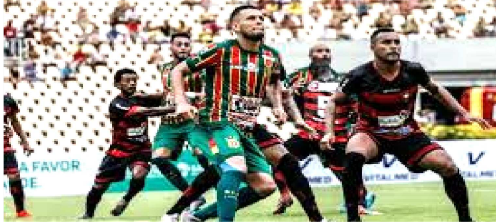
COM 5 PONTOS, SE VENCER, O PAPÃO SALTA PARA 8, E COLA NO MARACANÃ-CD

Com 5 pontos, se vencer, o Papão salta para 8, e ficará com o mesmo número de pontos do Maracanã, hoje ocupando a segunda colocação. Na disputa pelo critério de desempate, os rubro-negros se igualarão com o time cearense no número de vitórias e a decisão vai para o saldo de gols. O importante, porém, é que os motenses permanecerão no G4, entre os três primeiros colocados. Já o Sampaio Corrêa, que tem apenas 3 pontos, vencer será importante para chegar a 6 e ultrapassar o velho rival. Assim, fi-