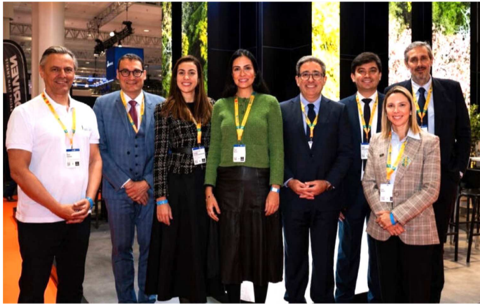
REPRESENTANTES DO GOVERNO DESTACARAM O PAPEL DO ESTADO EM HANÔVER

A participação do Governo do Maranhão, por meio da Investe Mara-