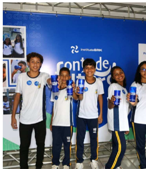
O brinde dos alunos com a água potável na sede da escola na zona rural de Ribamar

saúde se firmou. A água pura na torneira traz saúde pra criança e ajuda a gente a crescer. Na zona rural vivemos, com orgulho e com valor; e receber esse cuidado nos traz muito mais vigor”, concluiu o aluno.