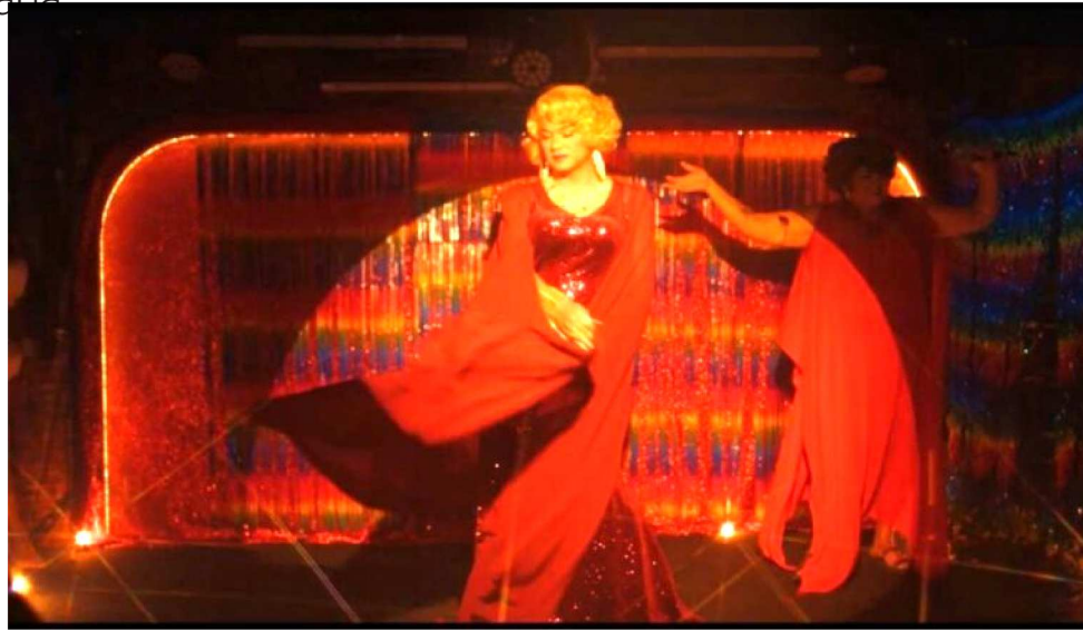
CURTA DESTACA A ESPIRITUALIDADE E A REINVENÇÃO DIÁRIA DIANTE DE ADVERSIDADES

Sinopse: Ainda Te Amo é um curta brasileiro, produzido e lançado em 2026, dirigido por Hsu Chien Hsin e com roteiro/atuação do maranhense Fernando Braga. O drama aborda a