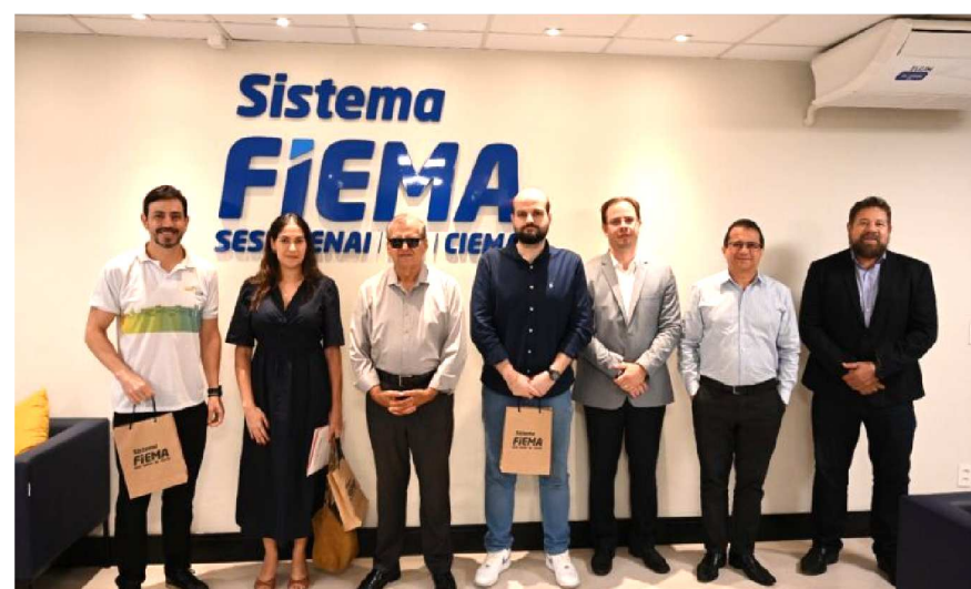
FIEMA e CIEMA apresentam à Prefeitura de São Luís os impactos econômicos e sociais da criação da Resex Tauá-Mirim

A advocacia previdenciária maranhense está prestes a vivenciar um marco de atualização e networking. Nos dias 30 e 31 de julho, a capital recebe o “ELEVAPREV OAB/MA – Círculo Previdenciário de Alta Performance”, evento de fôlego assinado pela OAB Maranhão, via ESA/MA, em parceria com a Comissão de Direito Previdenciário. O encontro foi estrategicamente desenhado para profissionais que buscam superar o básico e dominar estratégias de mercado contemporâneas. Com grandes nomes do cenário local e nacional, o evento oferece duas modalidades de imersão — Área Normal e Área VIP —, garantindo conteúdo prático e conexões de alto nível para quem deseja alcançar um novo patamar de resultados na carreira jurídica.