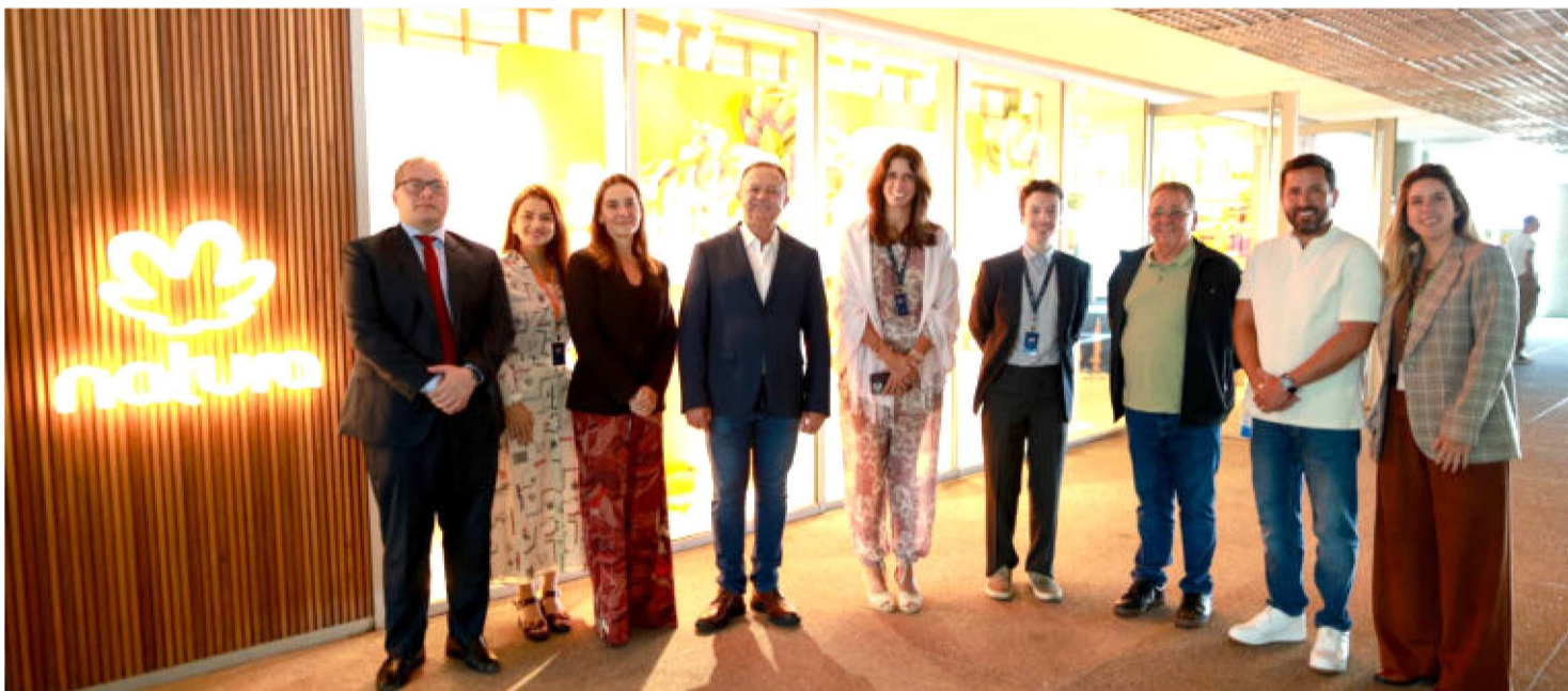
BRANDÃO VISITOU A SEDE DA NATURA E APRESENTOU A REPRESENTANTES DA DIRETORIA AS POTENCIALIDADES DO MARANHÃO

Durante a agenda institucional em São Paulo para a promoção do São João do Maranhão 2026, a comitiva do Governo do Estado também aproveitou para prospectar parcerias que promovam o desenvolvimento sustentável. Na manhã de segunda-feira (4), o governador Carlos Brandão fez uma visita à sede da empresa Natura, na capital paulista, e conversou com representantes da diretoria sobre potencialidades do estado.