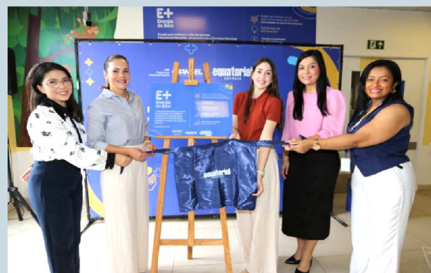
Momento solene de entrega oficial do projeto de eficiência energética E+ Energia do Bem.