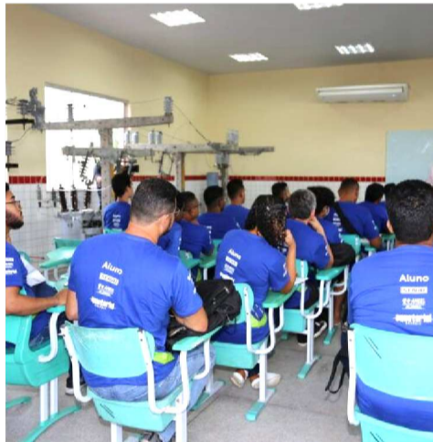
“A Escola de Eletricistas é um proje-

ção aproximada de quatro meses, além de uma ajuda de custo mensal, contribuindo para a permanência dos alunos durante o período de capacitação. Ao longo do curso, os participantes são preparados para atuar diretamente em redes de distribuição de energia, com foco em segurança, qualidade e eficiência.