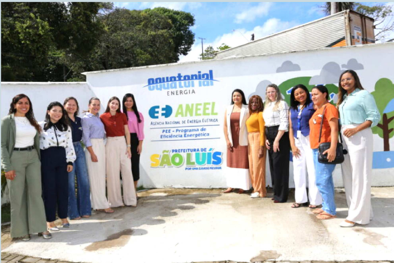
Representantes da Equatorial Maranhão e da Prefeitura de São Luís reunidos na sede do Hospital da Criança