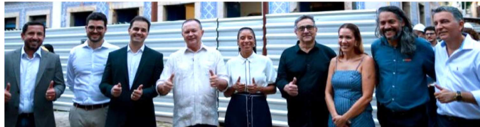
OBRAS SÃO EM PARCERIA DOS GOVERNOS DO ESTADO, FEDERAL E INICIATIVA PRIVADA

O lançamento das ações ocorreu no Convento das Mercês, localizado no bairro do Desterro, reunindo representantes dos governos estadual e federal, além de instituições ligadas à preservação do patrimônio histórico. As medidas integram uma estratégia de recuperação do conjunto arqui-