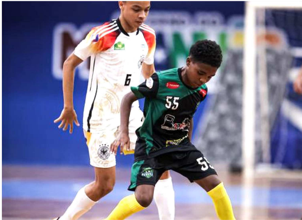
FEDERAÇÃO DO MARANHÃO DIVULGOU CRONOGRAMA DE TORNEIOS EM 2026.

Uma das principais novidades da Fefusma para a temporada de 2026 é o retorno da Copa Alim Maluf, um dos torneios mais tradicionais de futsal do Maranhão e que valerá vaga na Copa Nordeste. As inscrições para a Copa Alim Maluf, que vai abrir o calendário do futsal maranhense, podem ser feitas até o dia 25 de maio. Além disso, a entidade confirmou uma mudança na disputa dos Estaduais: as categorias