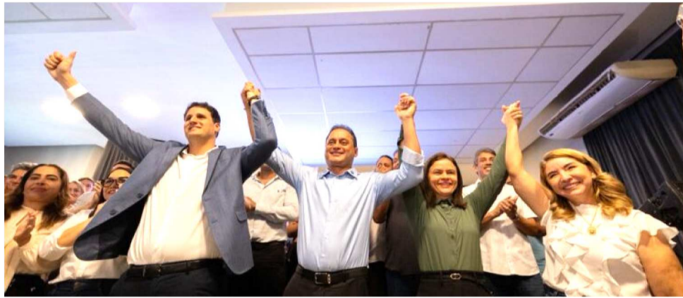
SENADOR FARÁ PARTE DA CHAPA MAJORITÁRIA DE ORLEANS PARA O GOVERNO

Apesar do novo cenário, Weverton buscou transmitir discurso de unidade e reafirmou que o grupo governista terá apenas dois candidatos ao Senado. “O governador Brandão, líder desse grupo, já deixou claro que vai ter