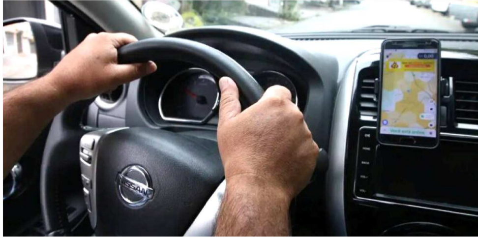
DUAS AÇÕES RELATADAS PELOS MINISTROS FACHIN E MORAES SERÃO JULGADAS

Corte terá impacto em 10 mil processos que estão parados em todo o país à espera do posicionamento do plenário sobre a questão.