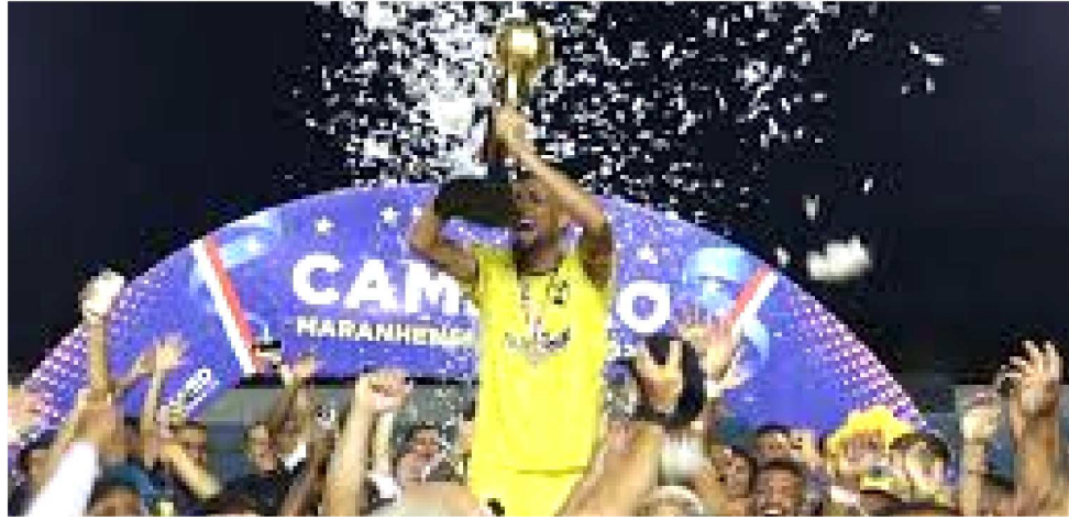
O IAPE, ATUAL CAMPEÃO MARANHENSE, AINDA NÃO VENCEU NA SÉRIE D DO BRASILEIRO

O maior desafio do Moto Club no Grupo A6, é ganhar do Maracanã, no Castelão, às 17h de hoje (sábado). Com 9 pontos, o Rubro-Negro, se conseguir seu objetivo, se aproximará do adversário, que tem 13, e atualmente ocupa a segunda colocação. Para vol-