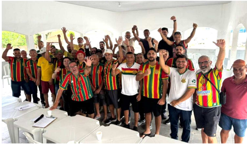
A REUNIÃO SERÁ REALIZADA, ÀS 9H, NO SINDICATO DOS SERVIDORES DO DETRAN-MA

cutida a abertura de um processo administrativo para apurar supostas irregularidades na condução do clube. Caso o procedimento avance, a atual diretoria poderá ser afastada do comando do Sampaio Corrêa.