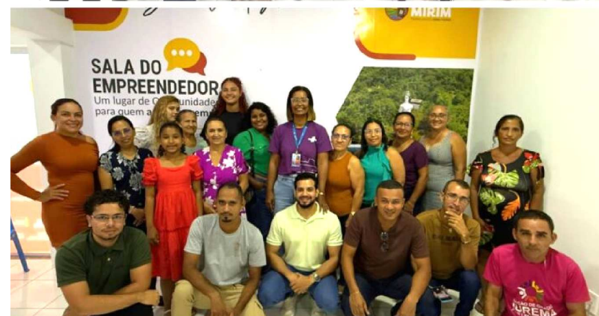
Em São Luís, as atividades da Semana do MEI ocorreram na Unidade de Negócios do Sebrae e nas Salas do Empreendedor do Anjo da Guarda e da Cohab.