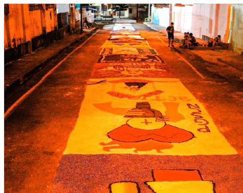
Segundo a coordenação do movi-

Em São Luís, uma das mobilizações acontece no Santuário Santuário Nossa Senhora de Nazaré, no Cohatrac. Na noite de quarta-feira (3), a partir das 19h30, paroquianos se reunirão na Rua B, do Cohatrac I, para confeccionar cerca de 120 metros de tapete que servirão de caminho para a procissão do dia seguinte.