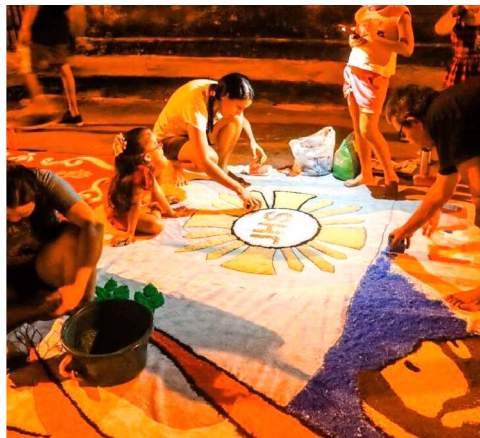
Os desenhos serão produzidos

principalmente com sal colorido e tinta, mas também utilizarão TNT, EVA, lonas e materiais recicláveis, transformando a via pública em uma grande manifestação artística e religiosa construída de forma coletiva.