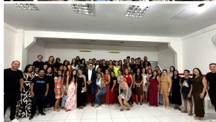
Além das capacitações, os participantes tiveram acesso a orientações especializadas e oportunidades de networking, fortalecendo conexões e ampliando perspectivas para o desenvolvimento dos negócios. Na Raposa, região metropolitana da capital, a programação desmistificou os impactos da Reforma Tributária para os microempreendedores individuais e apresentou o Contrata+Brasil, uma plataforma digital que simplifica e acelera a contratação de micro e pequenas empresas por órgãos públicos.