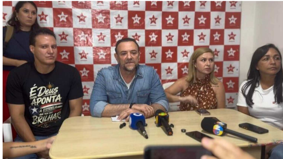
PRESIDENTE NACIONAL DO PT REFORÇA APOIO EXCLUSIVO DE LULA A FELIPE CAMARÃO