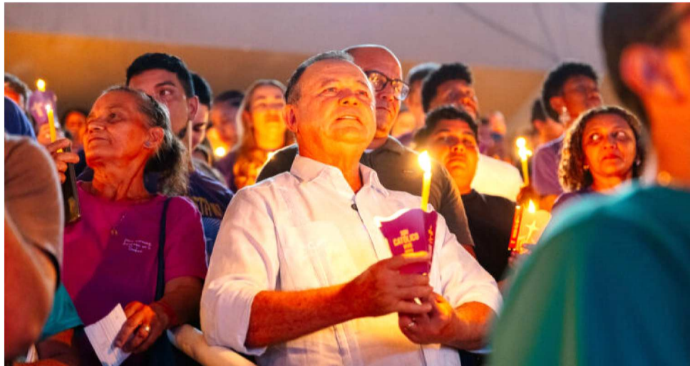
CARLOS BRANDÃO RESSALTOU O MOMENTO HISTÓRICO DA CELEBRAÇÃO EM SÃO LUÍS

Durante a celebração, o governador destacou a grande mobilização. “É um momento muito especial, com a presença de milhares de pessoas aqui no Castelão. Quero parabenizar todos os colaboradores que contribuíram para a realização deste grande evento. O Governo do Estado foi um importante parceiro nessa mobilização, mas, acima de tudo, destacamos a presença das famílias que vieram fortalecer a sua fé e viver este momento histórico de celebração de Corpus