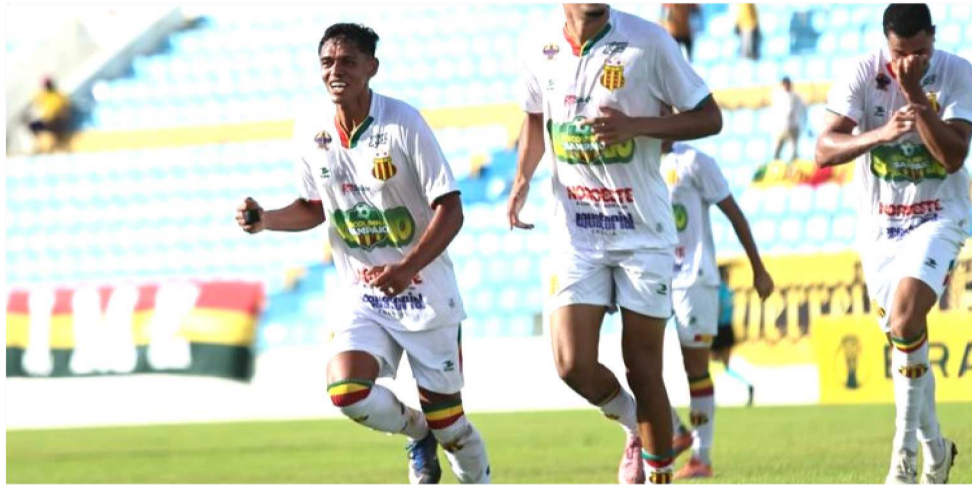
O SAMPAIO CORRÊA JÁ ESTÁ CLASSIFICADO PARA A PRÓXIMA FASE DA COMPETIÇÃO

Sampaio X Iguatu – Apesar de já ter uma vaga garantida, o Tricolor, que