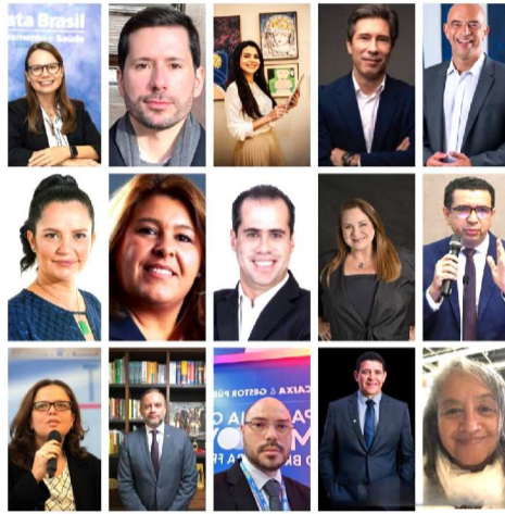
Vão participar do evento várias autoridades e especialistas no assunto

https://www.sympla.com.br/evento/iii-seminario-estadual-de-direito-do-saneamento-do-maranhao/3435386?referrer=www.google.com&referrer=www.google.com