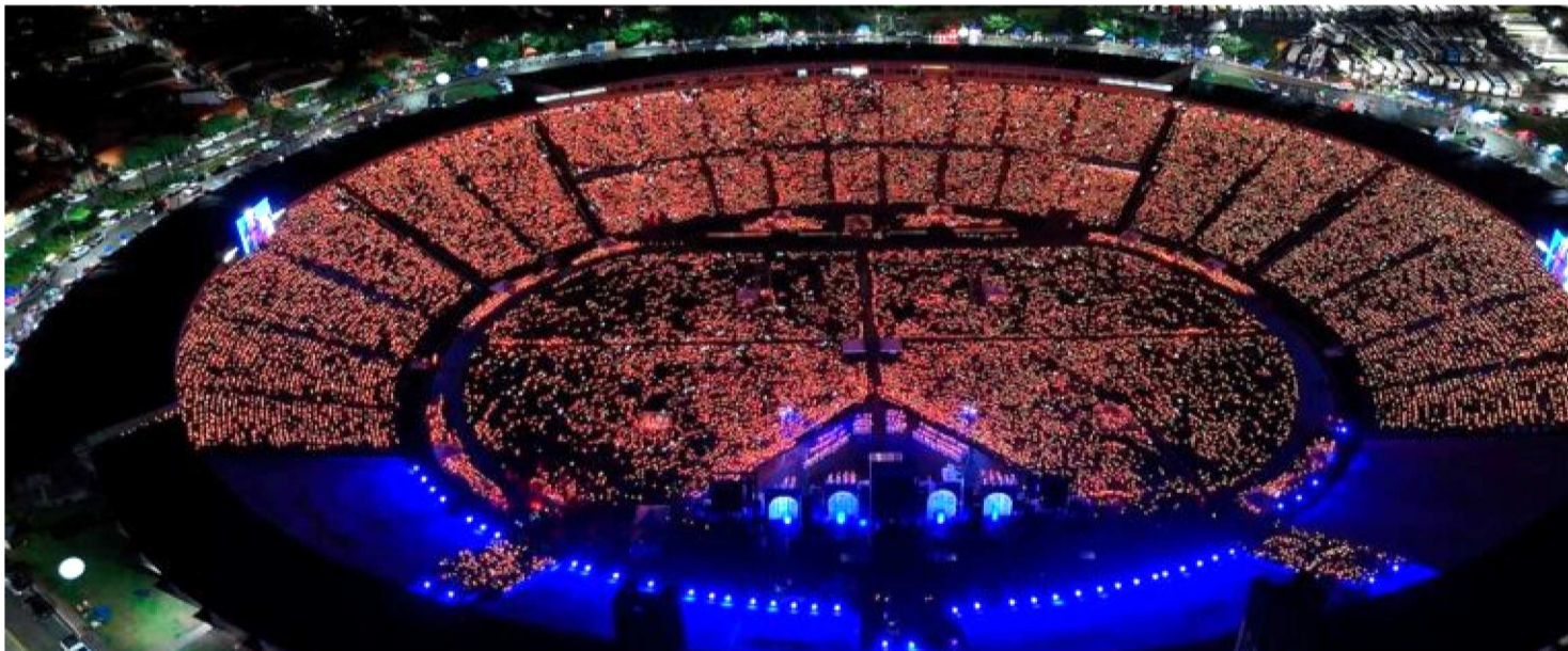
ESTADO CASTELÃO FICOU ILUMINADO PELAS VELAS DOS FIÉIS QUE COMPARECERAM A CELEBRAÇÃO DO CORPUS CHRISTI