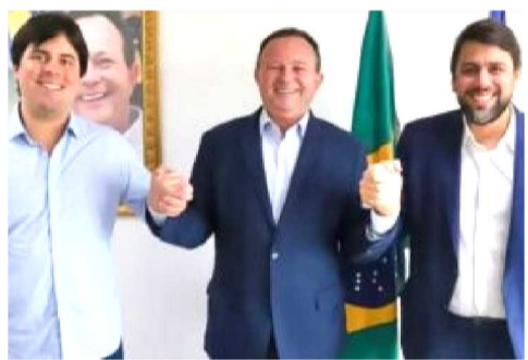
Diante de lideranças políticas e aliados, Brandão confirmou que a se-

A sucessão estadual de 2026 ganhou um novo capítulo no fim de semana após o governador Carlos Brandão (MDB) utilizar um ato político em Peritoró para fazer uma das sinalizações mais importantes da construção da chapa governista que deverá sustentar a candidatura de Orleans Brandão (MDB) ao Palácio dos Leões.