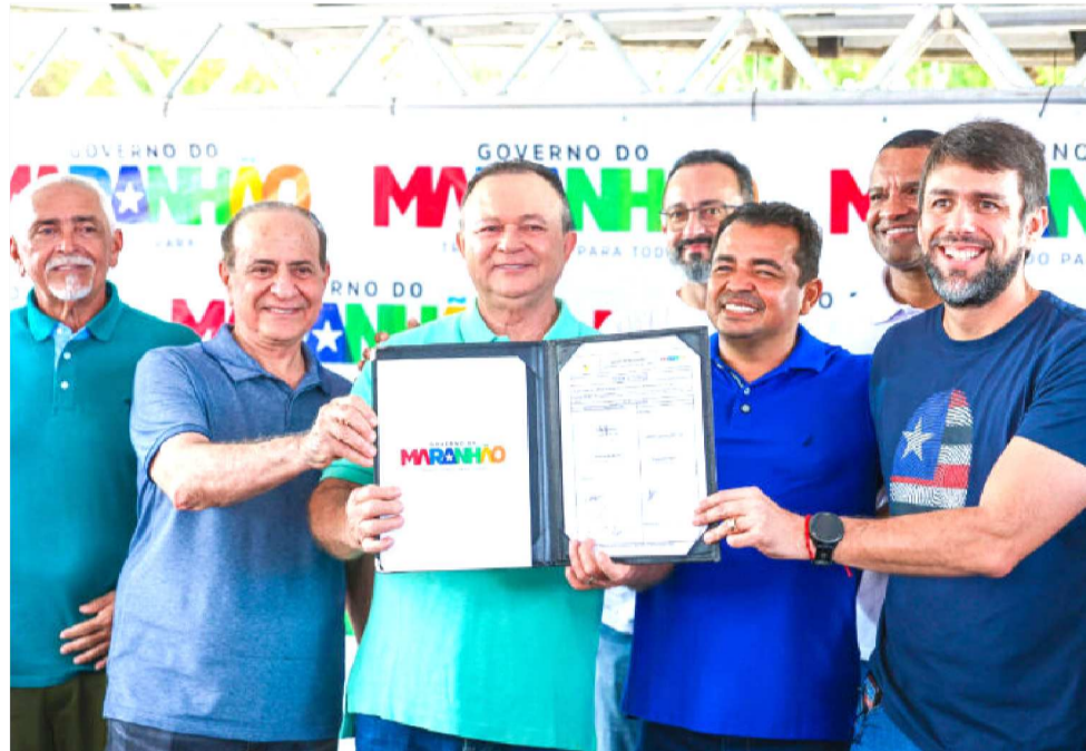
BRANDÃO AUTORIZA REFORMA DA PRAÇA DO VIVA DA CIDADE OPERÁRIA

A assinatura da ordem de serviço marca o início formal das obras de reforma do equipamento, consolidando investimento estadual voltado à me-