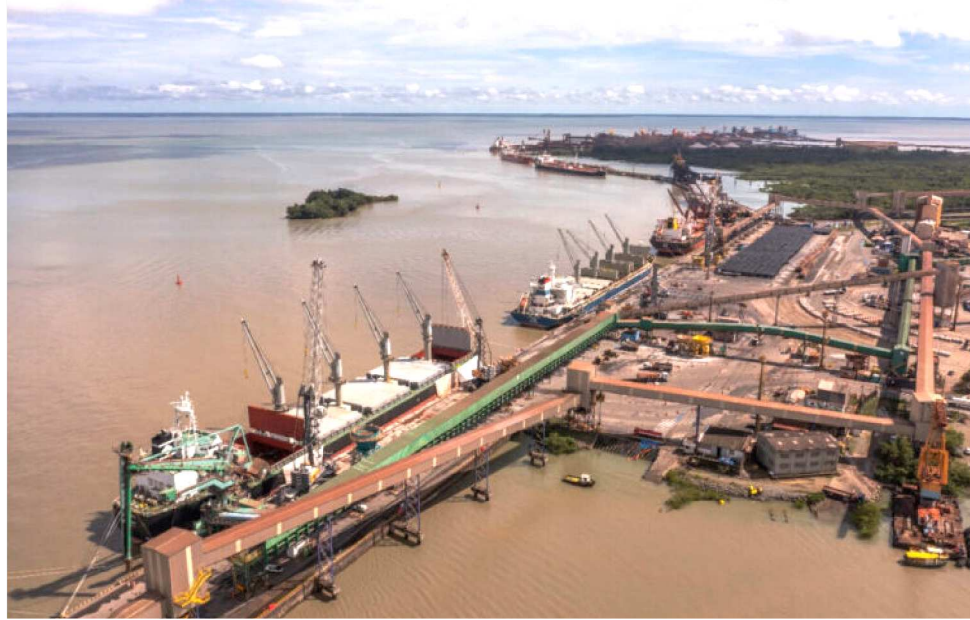
ESSE MONTANTE FOI RESULTADO DE US$ 1,65 BILHÃO EM VENDAS AO EXTERIOR

No topo dos parceiros comerciais do estado estão os Estados Unidos, liderando o intercâmbio com uma corrente de US$ 696,7 milhões, seguidos por China (US$ 615,9 milhões) e Rússia (US$ 436,7 milhões). Canadá, Ará-