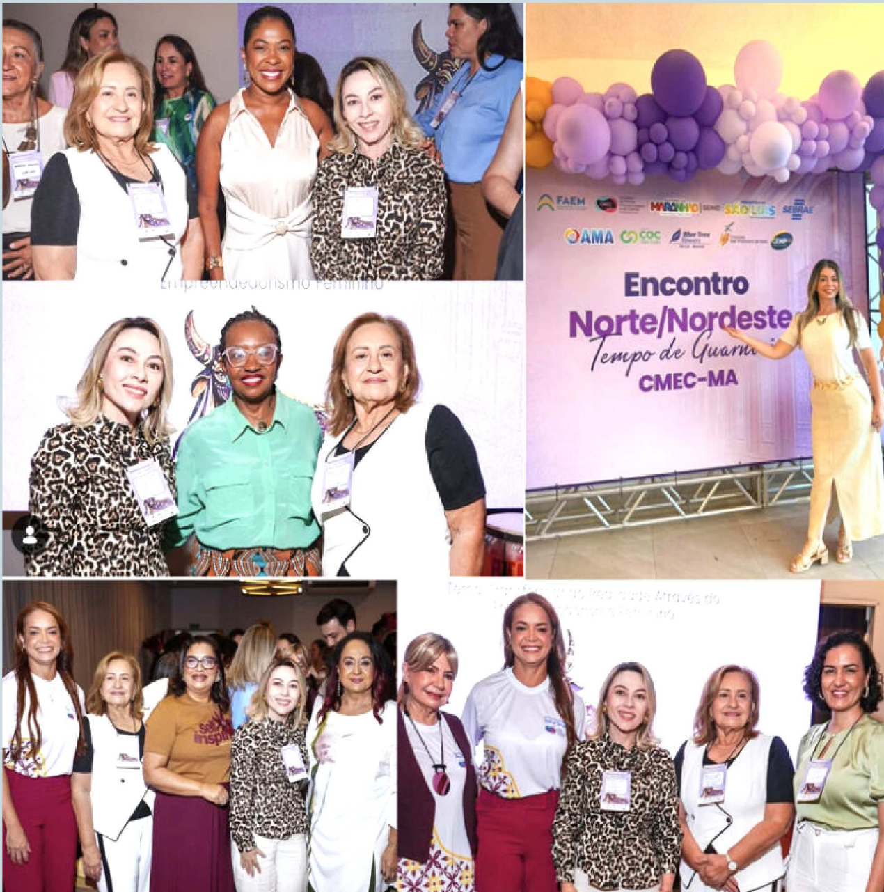
A realização do Encontro Norte/Nordeste CMEC Maranhão reforça a importância da união entre lideranças femininas e entidades representativas para a construção de um ambiente de negócios mais inclusivo, inovador e preparado para os desafios do futuro