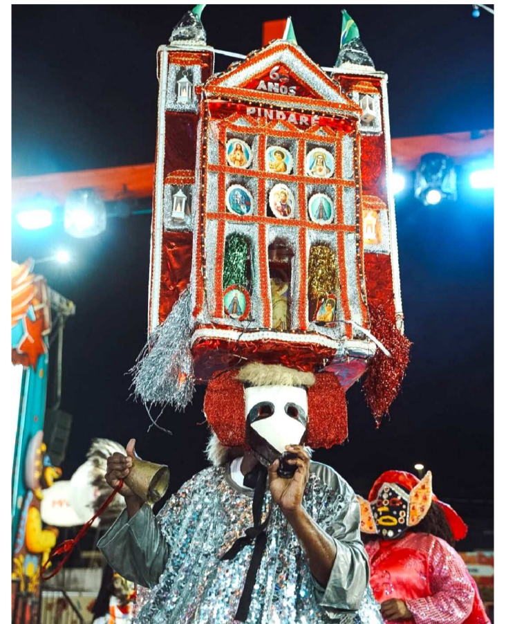
Cazumba do Boi de Pindaré