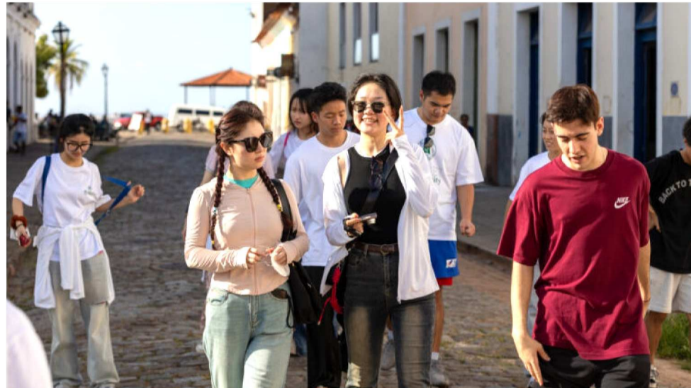
ESTADO É DESTAQUE NA CHEGADA DE TURISTAS INTERNACIONAIS AO BRASIL EM 2026

O Maranhão registrou alta de 257,1%, saindo de 28 para 100 chegadas estrangeiras nos primeiros quadrimestres de 2025 e 2026, respectiva-