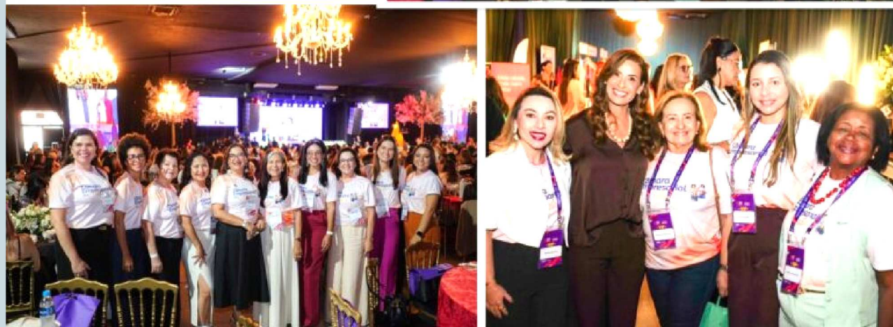
A iniciativa promoveu uma intensa troca de experiências, rodadas de networking e a integração direta com lideranças empresariais e corporativas de diferentes regiões do estado.