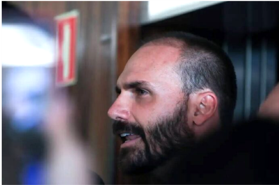
DECISÃO DA PRIMEIRA TURMA FOI POR 4 A 0

Os votos foram proferidos pelo relator, Alexandre de Moraes, e os ministros Cristiano Zanin, Cármen Lúcia e Flávio Dino.