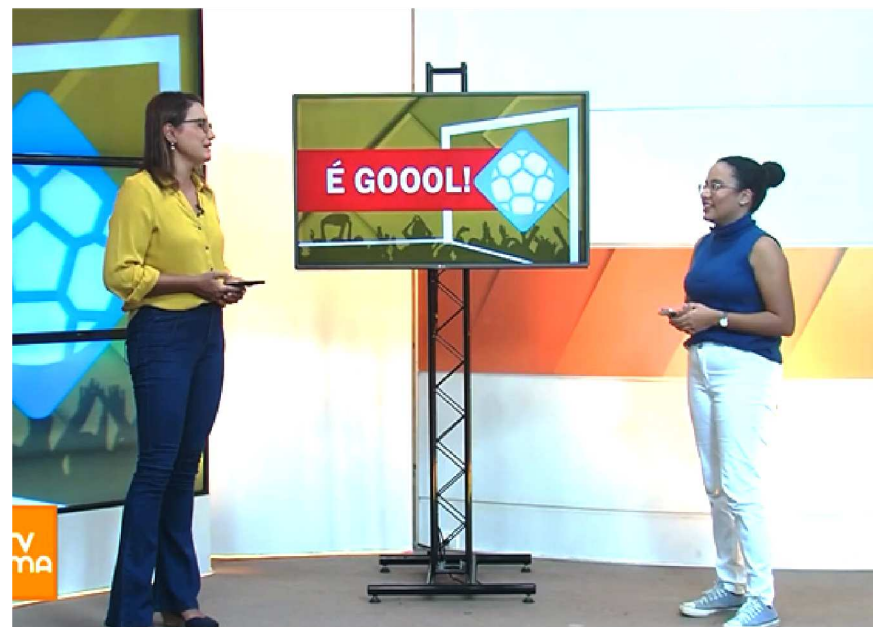
Em pauta, análises, curiosidades e os momentos mais marcantes do Mundial, aproximando ainda mais o público da emoção desta Copa do Mundo