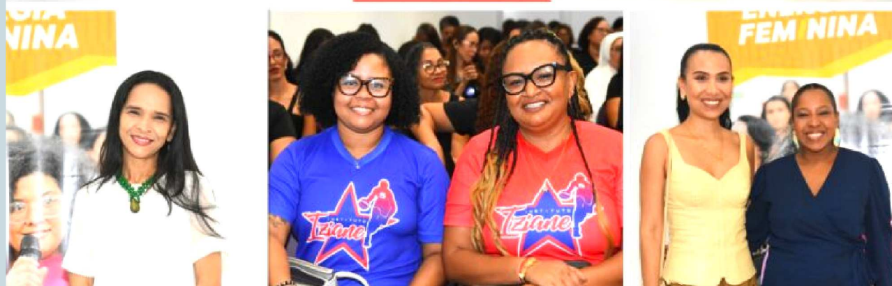
A solenidade de certificação da primeira turma do projeto Energia Feminina no Maranhão foi marcada pela emoção e pelas histórias de superação de cada uma das 112 participantes que concluíram essa capacitação