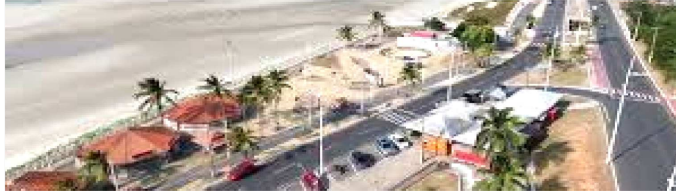
LITORÂNEA RECEBEU MAIS SEGURANÇA POR SER UMA ÁREA DE GRANDE CIRCULAÇÃO