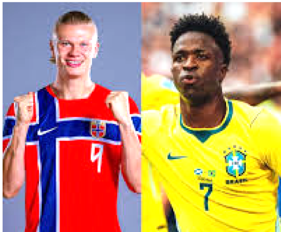
VAMOS VER O CONFRONTO ENTRE VINI JR. CONTRA HAALAND NA PRÓXIMA FASE

O Brasil chega embalado após a vitória de virada sobre o Japão, enquanto a Noruega garantiu a classificação ao eliminar a Costa do Marfim. Além da vaga nas quartas de final, o duelo colocará frente a frente duas seleções com um histórico curioso: os noruegueses nunca perderam para o Brasil em quatro confrontos disputados.