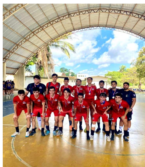
O Tribuna é o atual campeão do CAMA, na UFMA