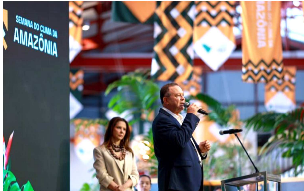
O GOVERNADOR CARLOS BRANDÃO ESTEVE PRESENTE NA ABERTURA DO EVENTO

Durante a abertura do evento desta segunda-feira, o governador maranhense Carlos Brandão, que preside o Consórcio Interestadual de Desenvolvimento Sustentável da Amazônia Legal, entidade organizadora da Semana do Clima da Amazônia, reafirmou o compromisso com a união de esforços para a preservação do meio ambiente e com o desenvolvimento da região de forma sustentável. “Foi muito importante trazer a COP 30 para dentro do coração da Amazônia. Nós somos a maior reserva ambiental do mundo e essa discussão precisava acontecer no Brasil, para que pudéssemos colocar as nossas experiências,