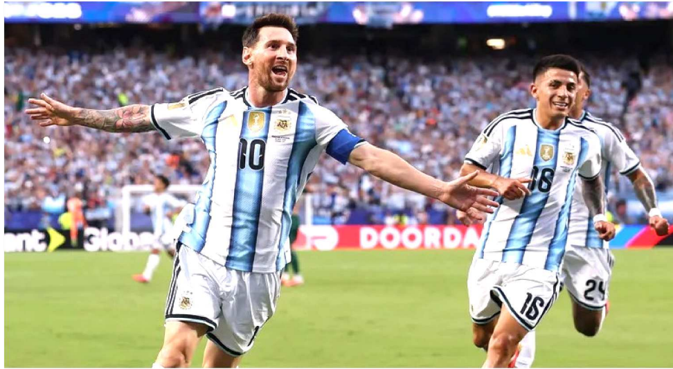
LIONEL MESSI QUER AMPLIAR ARTILHARIA CONTRA CABO VERDE NESTA SEXTA

Lionel Scaloni, técnico da Argentina, reconhece o favoritismo neste jogo, mas pediu cuidado com os africanos, lembrando que eles empataram com Espanha e Uruguai, que ficou de fora do mata-mata. Sobre a escalação, o zagueiro Cristian Romero se recuperou de lesão na coxa direita e vai a