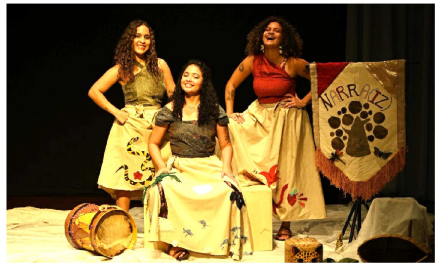
Projeto do Grupo Narraiz reúne teatro, contação de histórias e formação artística em seis atividades abertas ao público