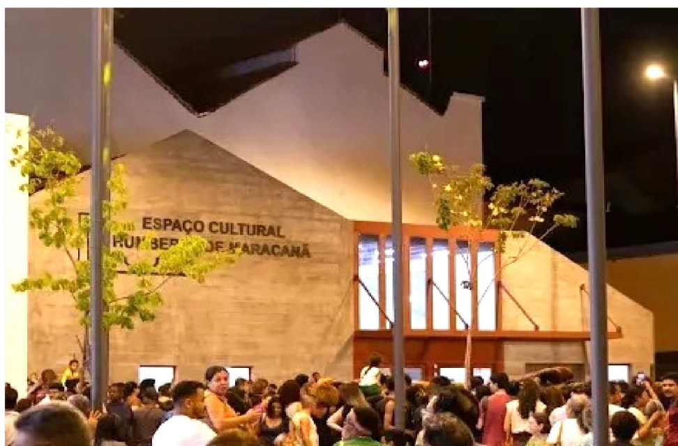
A FEIRA REÚNE MATERIAL DE VINIL DE AO MENOS SEIS LOJAS COM ATUAÇÃO EM SÃO LUÍS