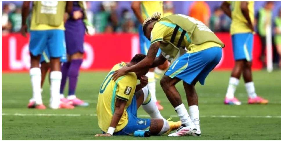
A SELEÇÃO FOI ELIMINADA EM CAMPO, MAS CBF RECEBE BOA GRANA

Ao não se classificar para as quartas de final, todavia, a CBF perdeu a oportunidade de brigar por cotas maiores na distribuição financeira e deixou de arrecadar até US$ 27 milhões (cerca