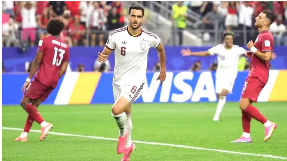
A ESPANHA VEM DE ELIMINAR PORTUGAL E É APONTADA FAVORITA

Luis de la Fuente, técnico da Espanha, disse que sua seleção passou pela "primeira final antecipada da Copa do Mundo" ao eliminar Portugal de Cristiano Ronaldo nas oitavas. O treinador espanhol, que vai manter a base que vem jogando, afirmou que sua equipe aposta na velocidade dos passes para neutralizar a forte marcação