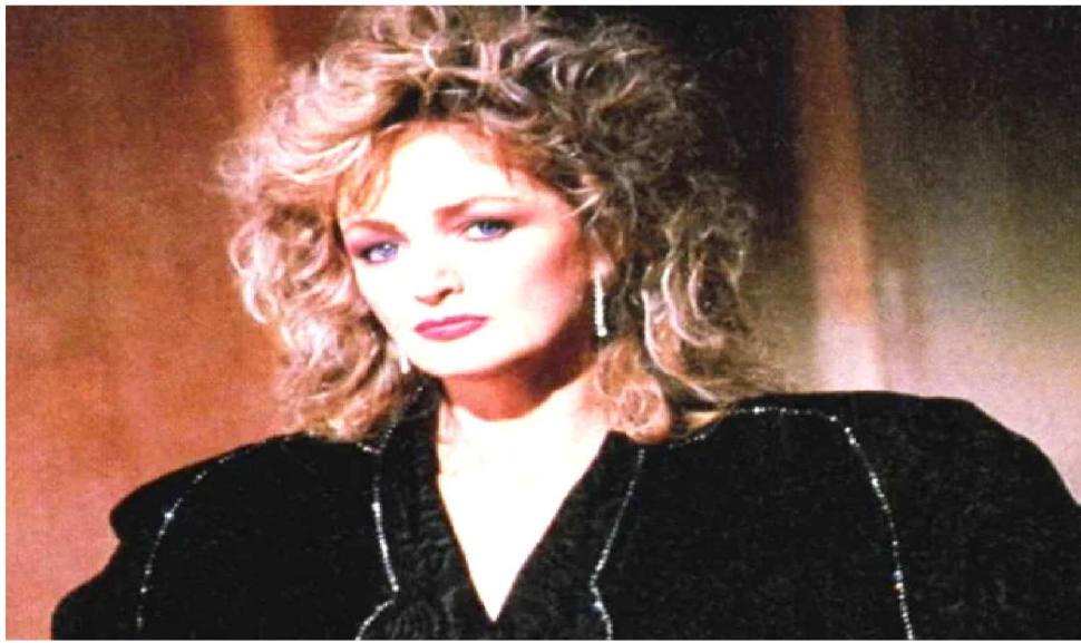
UMA DAS VOZES MAIS MARCANTES DO POP ROCK, MORREU AOS 75 ANOS

Tyler alcançou reconhecimento com o hit Total Eclipse of the Heart, lançado em 1983. O hit, produzido por Jim Steinman, liderou as principais paradas musicais do mundo e se consolidou como um hino atemporal