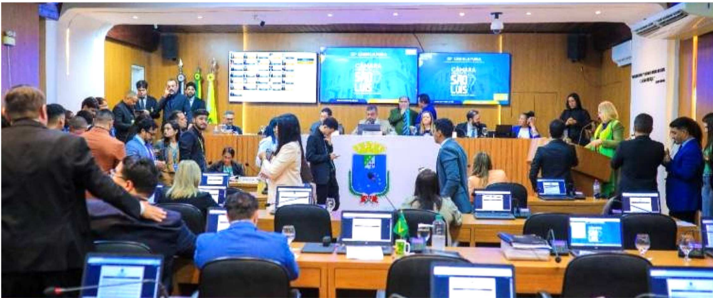
PROJETO FOI PROTOCOLADO NO FIM DE AGOSTO E JÁ PASSOU PELAS ANÁLISES TÉCNICAS DA COMISSÃO DE ORÇAMENTO E FINANÇAS