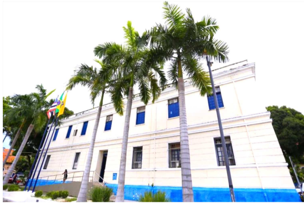
PLANO PLURIANUAL DEFINE DIRETRIZES, METAS E APLICAÇÃO DOS RECURSOS PÚBLICO

Considerado o principal instrumento de planejamento da administração pública municipal, o Plano Plurianual define as diretrizes, metas e programas que irão orientar a aplicação dos recursos públicos ao longo de quatro anos. É a partir dele que o município estabelece prioridades, organiza investimentos e dá previsibilidade às políticas públicas, impactando diretamente áreas como saúde, educação, mobilidade urbana, infra-