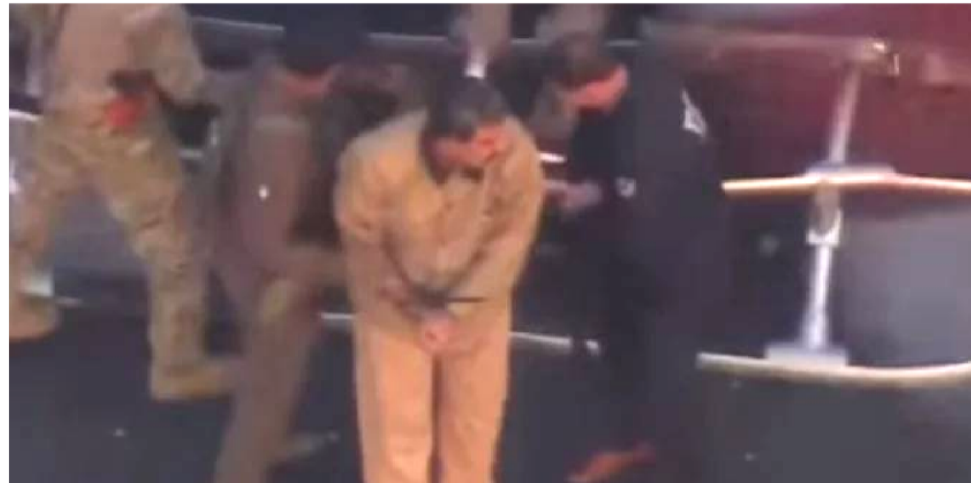
"SOU UM HOMEM DECENTE. NÃO SOU CULPADO DE NADA", DISSE NICOLÁS MADURO

Segundo informações da emissora CNN, durante a sessão, Maduro afirmou ser inocente. "Sou um homem decente. Não sou culpado de nada do que está sendo mencionado aqui", declarou diante do tribunal.