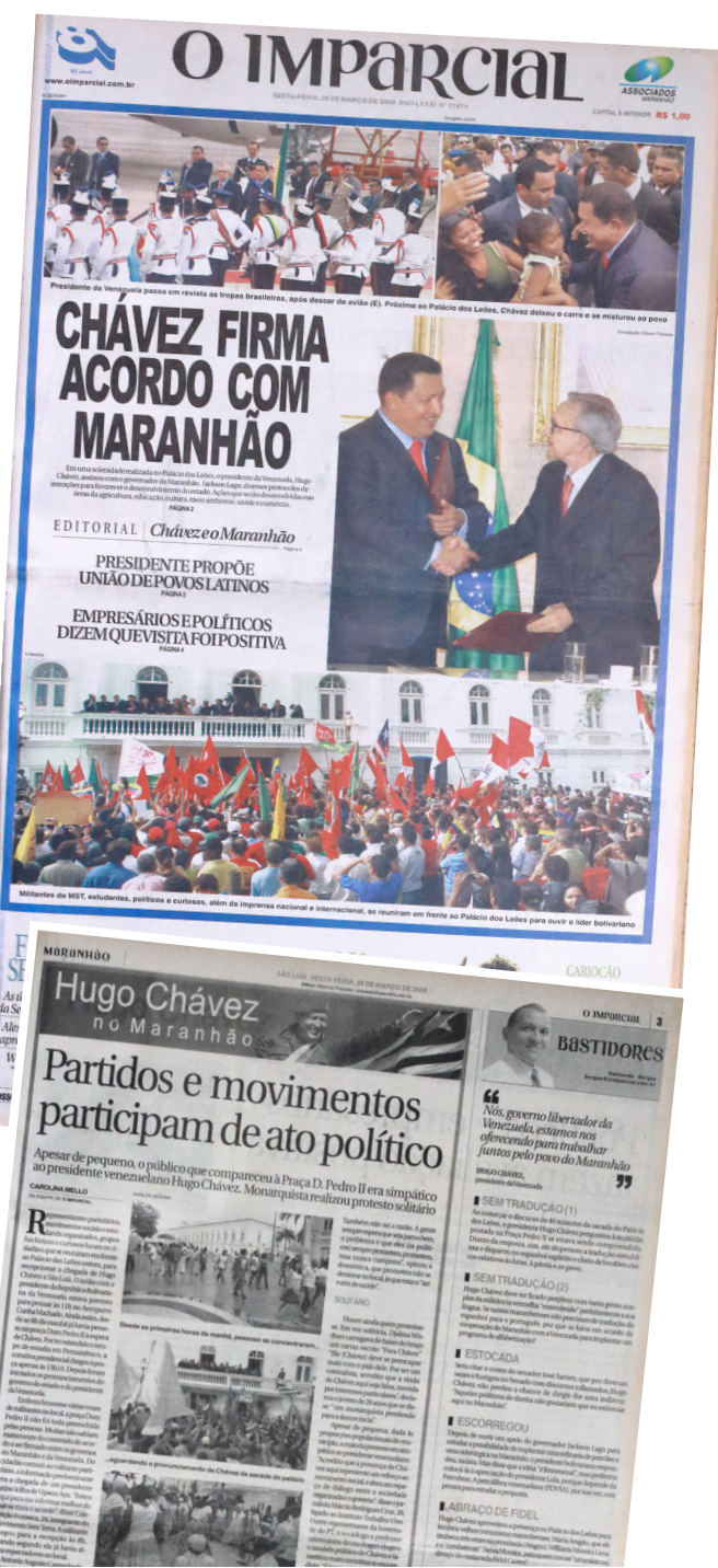
JORNAL O IMPARCIAL REGISTROU A VISITA Hugo Chávez no Maranhão no ano de 2008 no dia 27 de março. Em seu discurso, o líder venezuelano prometeu empenho junto ao governo federal para viabilizar uma refinaria de petróleo no estado. Chávez foi condecorado com a medalha do Mérito Timbira, a mais alta honraria do estado do Maranhão.