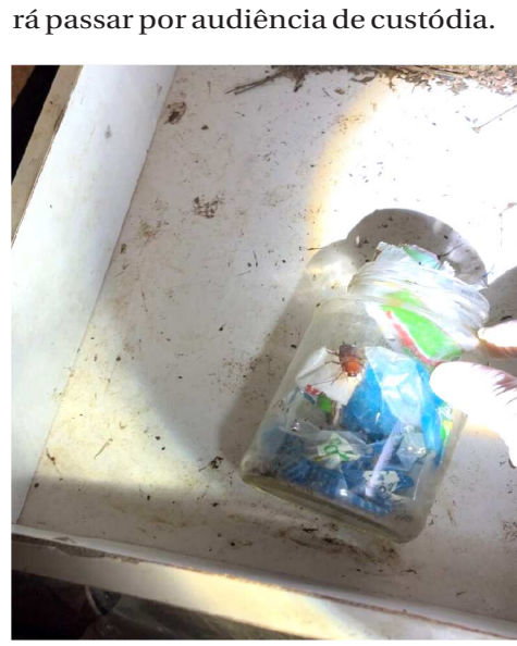
Mãe é presa por deixar filha deficiente trancada

Após a adoção das medidas legais cabíveis, a presa foi encaminhada a uma unidade prisional, onde permanecerá à disposição da Justiça e deve-