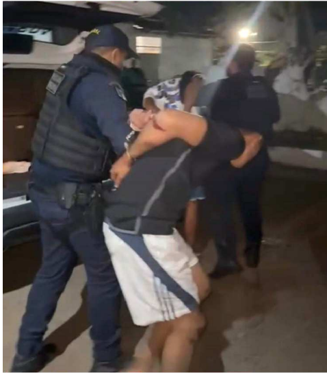
Ambos fizeram manobras proibidas

G uardas municipais da Ronda na Rua, do Polo Coroadinho, capturaram dois homens que desobedeceram à ordem de parada em duas ocasiões consecutivas na região do João Paulo.