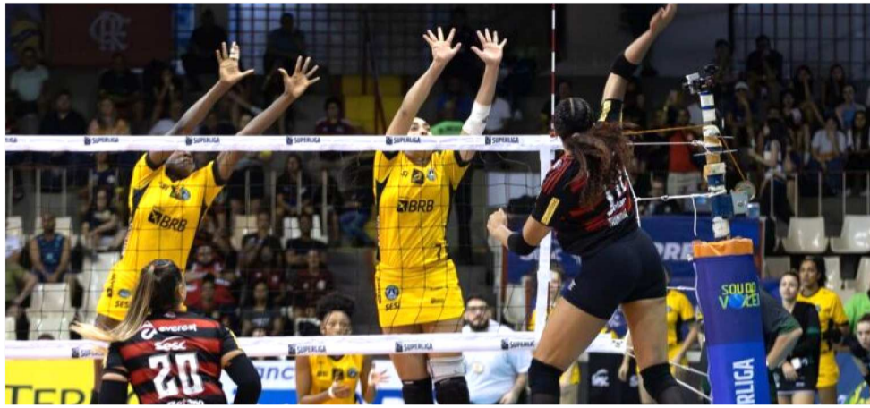
BRÁSILIA VÔLEI E SESC FLAMENGO FARÃO JOGO HISTÓRICO NA CAPITAL MARANHENSE

O ingresso solidário para a partida entre Brasília Vôlei e Sesc Flamengo