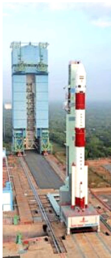
Foguete PSLV-C62 na base indiana Satish Dhawan Space Centre.

Desde a sua criação, em 10 de fevereiro de 1994, a Agência trabalha para viabilizar os esforços do Estado Brasileiro na promoção do bem-estar da sociedade, por meio do emprego soberano do setor espacial.