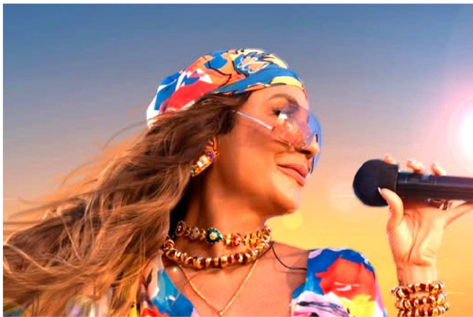
IVETE SANGALO É UMA DAS GRANDES ATRAÇÕES NACIONAIS DO CARNAVAL DO MA

Dados apresentados pelo governo estadual mostram a dimensão do evento. Em 2025, cerca de 4,5 milhões de foliões passaram pelos circuitos oficiais, com 95% de ocupação hoteleira e mais de R$ 800 milhões movimentados na economia. Para 2026, a projeção é superar esses números, impulsionada por uma programação ainda mais extensa, que começa em