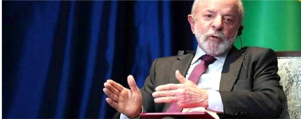
LULA IRONIZOU A FORMA COMO TRUMP TOMA POSIÇÕES POR MEIO DAS REDES SOCIAIS

Ao comentar o comportamento do mandatário norte-americano, Lula ironizou a forma como Trump se comunica e toma posições públicas por meio das redes sociais. "Vocês já perceberam que o presidente Trump quer governar o mundo pelo Twitter? É fantástico. Todo dia ele fala alguma coisa e todo dia fala da coisa que ele falou", afirmou o presidente brasileiro, ao destacar o impacto desse tipo