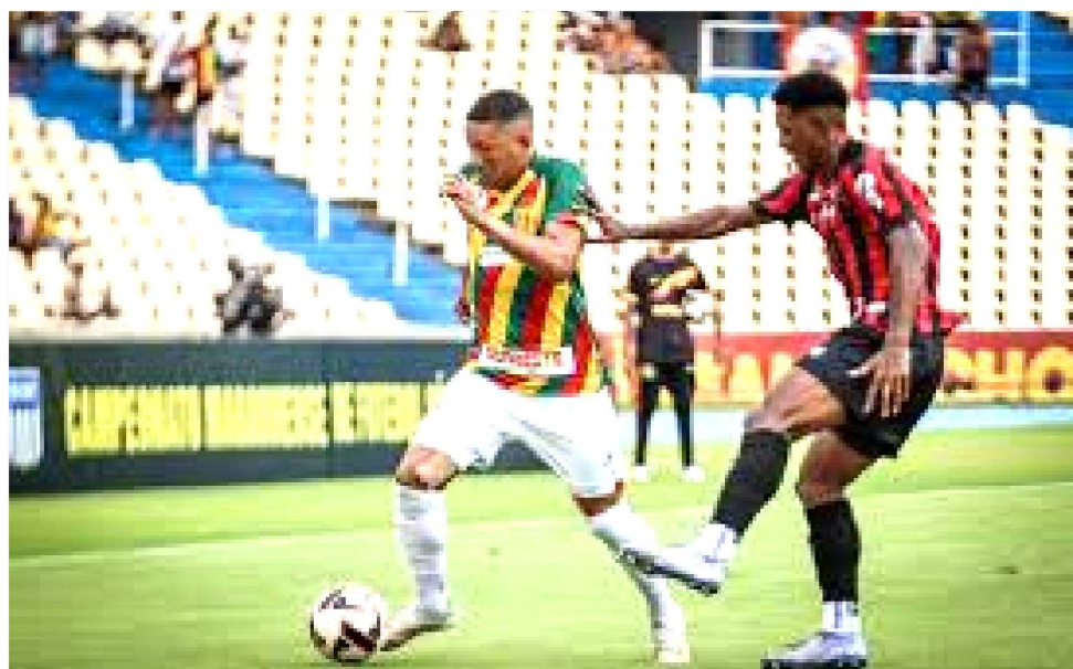
SAMPAIO E MOTO EMPATARAM DUAS VEZES NO CAMPEONATO MARANHENSE DE 2025

Já faz tempo que o Rubro-Negro não consegue ganhar do rival. Nas últimas dez partidas, o Papão só conseguiu vencer uma vez. O Tricolor obteve seis vitórias e aconteceram ainda três empates. No ano passado, os velhos rivais jogaram duas vezes pelo Campeonato Maranhense e foram re-