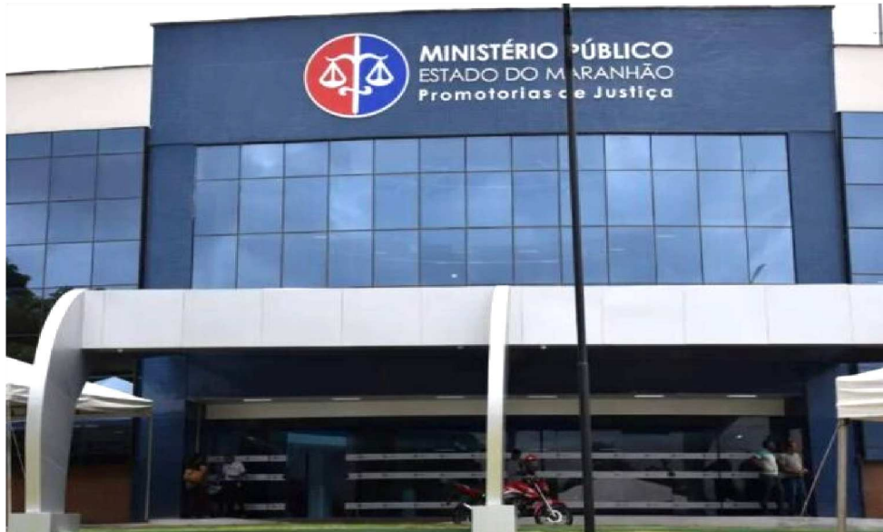
EM CASO DE DESCUMPRIMENTO, FOI SOLICITADO BLOQUEIO DE VALORES EM CONTAS