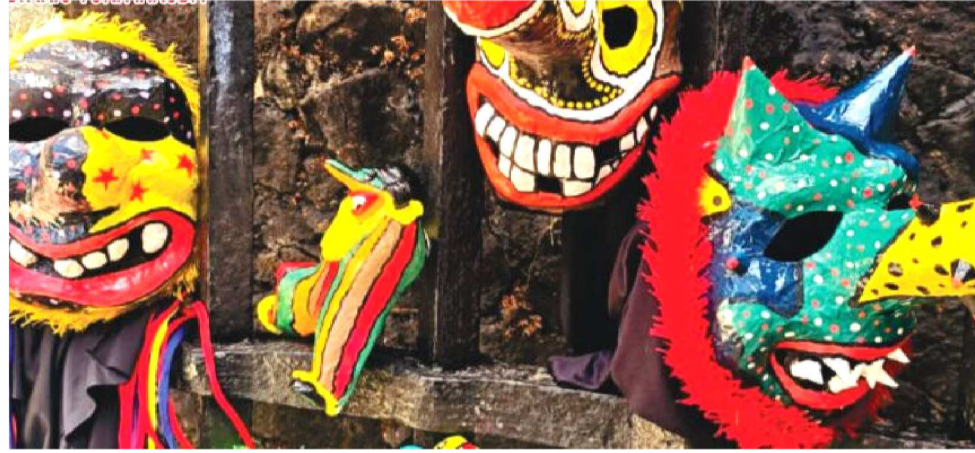
EXPOSIÇÃO DE MÁSCARA DE FOFÃO NO CAFUA REVERÊNCIA O CARNAVAL TRADICIONAL

A exposição surgiu a partir da oficina homônima, que ocorre até o dia 3 de fevereiro, na qual máscaras são