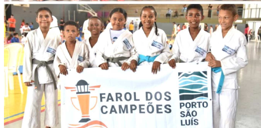
Além dos treinos semanais, o Porto São Luís patrocina a participação dos judocas em diversos campeonatos locais e nacionais, e isso tem contribuído para aumentar a motivação dos atletas e seus resultados.