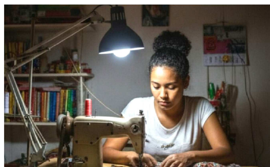
Atualmente, a Equatorial Maranhão atende mais de 2,9 milhões de clientes em todo o estado