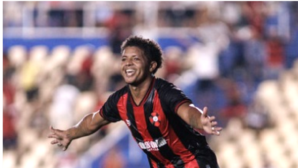
PAPÃO DO NORTE TEM UM DOS MELHORES ATAQUES DO CAMPEONATO MARANHENSE

As surpresas ficam claras a partir de um momento em que os torcedores estavam desconfiados com o futuro, devido às etapas difíceis enfrentadas desde o início dos treinamentos – foi último a começar –; as dificuldades para montar o elenco por falta de recursos; ausência de um forte patrocinador; salários pagos fora do prazo; e até a saída do treinador Jairo Nascimento no dia de um Superclássico.