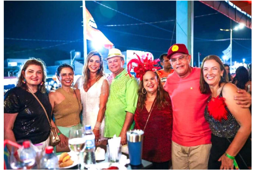
O governador Carlos Brandão esteve presente no circuito e reforçou o impacto positivo da pré-temporada carnavalesca para o estado. Segundo ele, a festa é estratégica para movimentar a economia local e gerar renda.