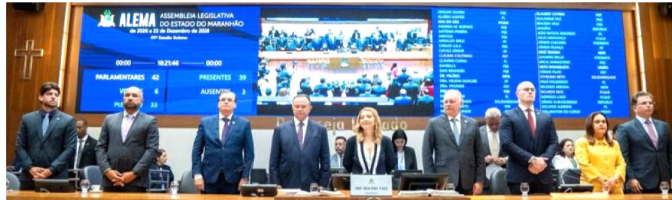
GOVERNADOR CARLOS BRANDÃO E AUTORIDADES PARTICIPARAM DA SOLENIIDADE

O cenário de eleições neste ano de 2026 também foi abordado por eles: “É nossa tendência termos a nossa independência, mas também trabalharemos em harmonia com os poderes. Esse ano de eleição, continuaremos com nossas divergências enquanto Casa parlamentar, mas também com nossa tranquilidade e respeito”, des-