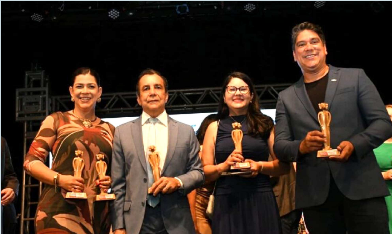
A cerimônia de entrega dos prêmios ocorreu no Teatro Sesc Napoleão Ewerton, em São Luís