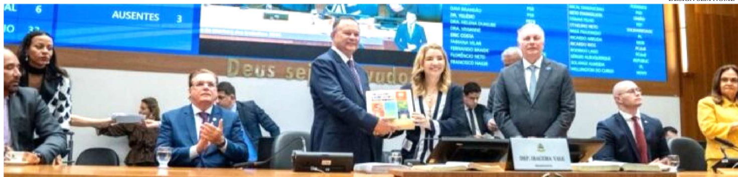
BRANDÃO ENTREGA MENSAGEM GOVERNAMENTAL EM ABERTURA DOS TRABALHOS NA ALEMA E REITERA PARCERIA COM A CASA