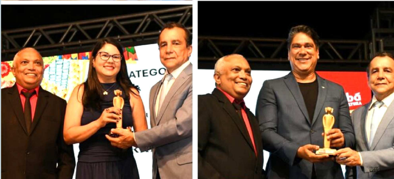
Festival Sabores do Mará ganhou a categoria Iniciativas que Transformam/O Mobiliza SLZ conquistou o troféu da categoria Cultura que Pulsa/A Assessoria de Comunicação do Sebrae levou o troféu na categoria Vozes que Falam o Maranhão