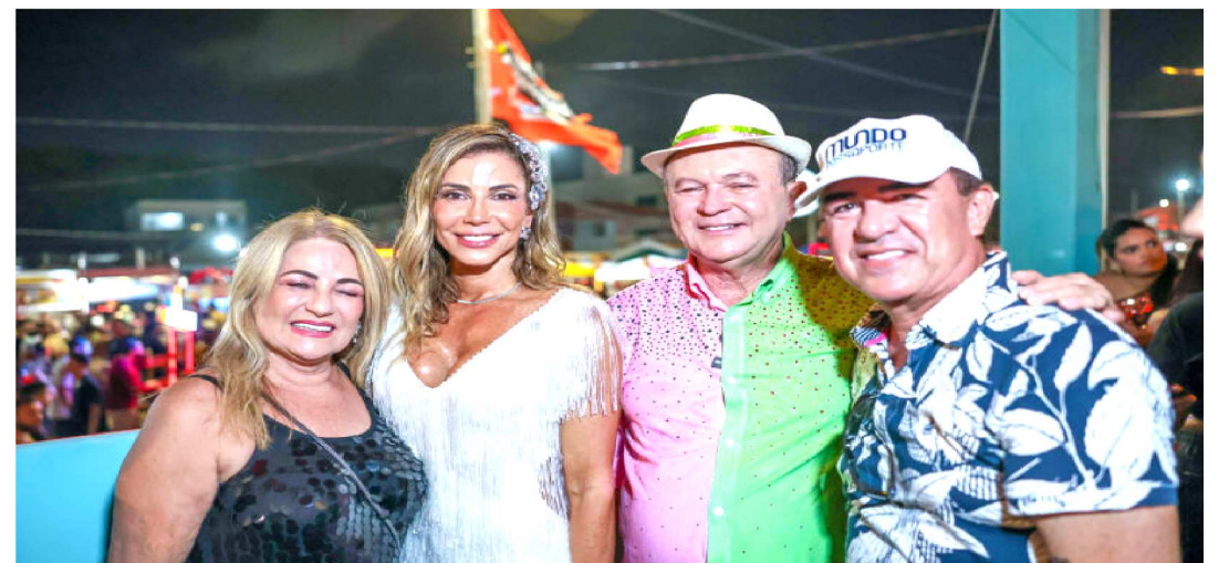
GOVERNADOR, CARLOS BRANDÃO E LARISSA BRANDÃO, COM MARCOS DAVI E MADALENA NOBRE

O circuito da Avenida Litorânea, se transformou no cartão-postal do Carnaval maranhense. Um corredor de alegria, estrutura, camarotes, segurança e grandes atrações nacionais, regionais e o calor do povo.