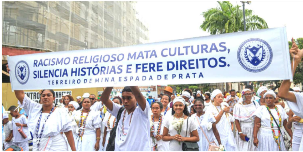
CORTEJO LEVOU MENSAGENS DE CONSCIENTIZAÇÃO CONTRA O RACISMO RELIGIOSO

Ação institucional promovida pelo Governo do Maranhão, por meio da Secretaria de Estado da Cultura (Secma), visa a promoção, visibilidade e protagonismo dos povos e comunida-