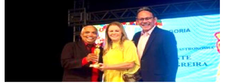
RESTAURANTE FLOR DE VINAGREIRA MELHOR DE SLZ