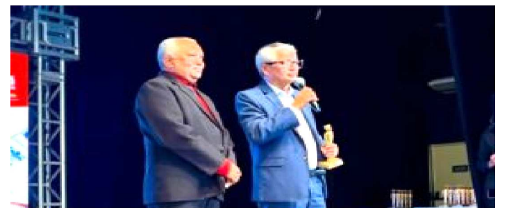
EUDES BARROS – PREFEITO DE RAPOSA