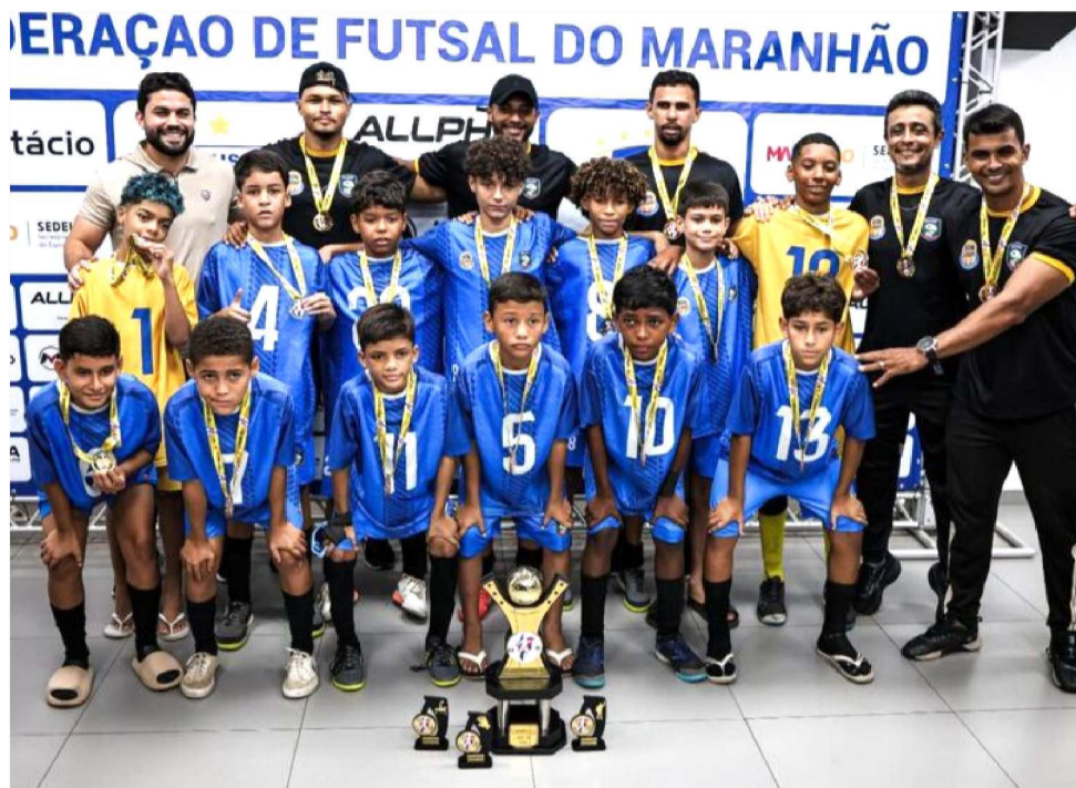
IFA REI DAVI, DE BOM LUGAR FOI O GRANDE CAMPEAO DA CATEGORIA SUB-11

As decisões dos torneios Sub-7 a Sub-15 do Maranhense de Futsal 2025 no Ginásio Castelinho foram marcadas pelo número elevado de equipes do interior, dado que reforça o desenvolvimento da modalidade em todo o Estado. Entre os 18 finalistas que estiveram em quadra em São Luís, 11 eram de outros municípios, com destaque para quatro campeões: AFC UDC, de Bacabal (Sub-7), IFA Rei Davi, de Bom Lugar (Sub-11), GBF Esportes, de Urbano Santos (Sub-14), e