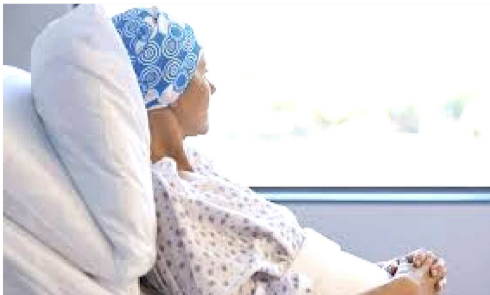
A CADA ANO, SURGEM CERCA DE 20 MILHÕES DE NOVOS CASOS NO MUNDO

Mundial do Câncer, celebrado em 4 de fevereiro, a discussão ganha ainda mais relevância. A data foi criada para conscientizar a população sobre prevenção, diagnóstico precoce e acesso ao tratamento. Especialistas reforçam