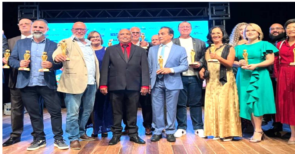
PROFISSIONAIS, GESTORES E EMPRESAS FORAM HOMENAGEADOS