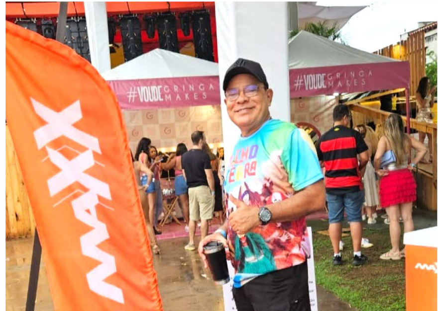
O jornalista NM esteve neste último domingo conhecendo a estrutura e ações de Marketing da Operadora Maxx