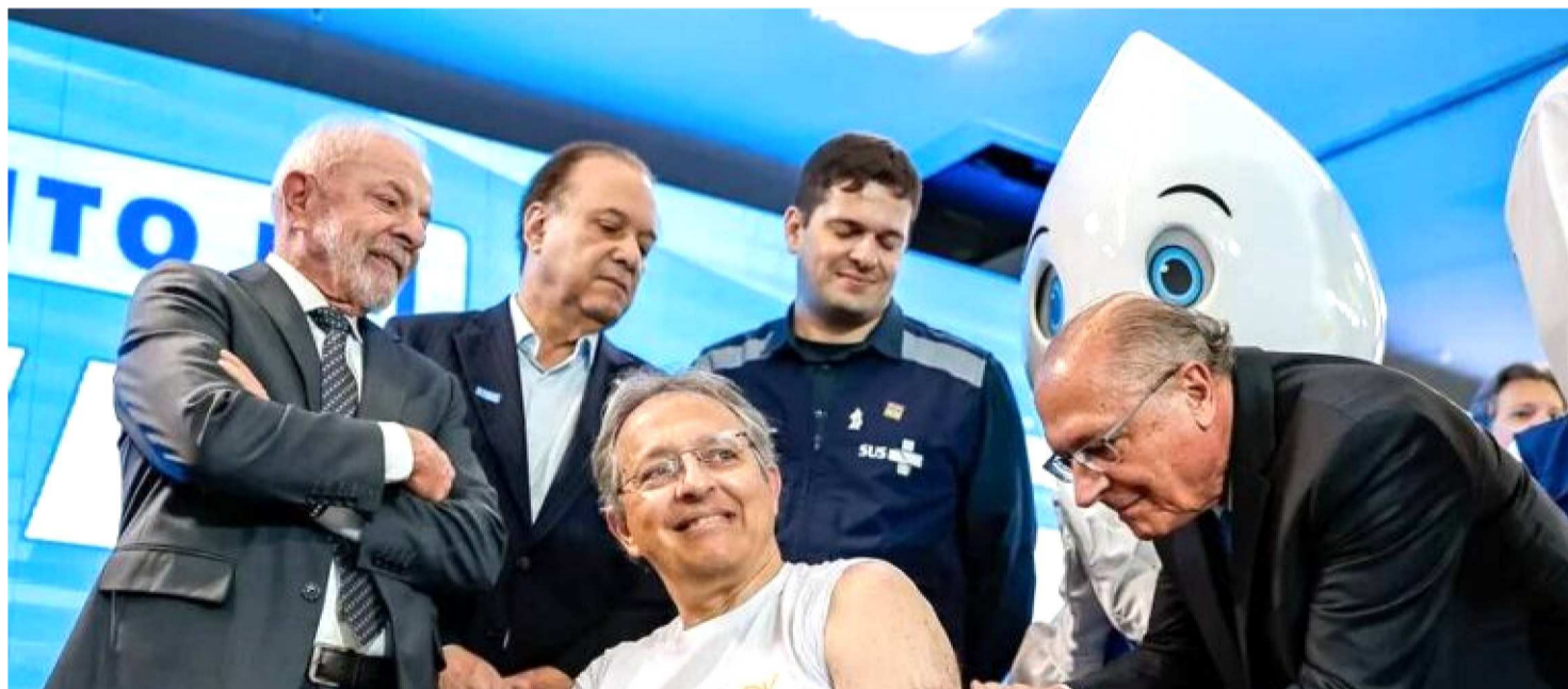
LULA BRINCOU COM TRUMP E DISSE QUE ELE NÃO CONHECE LAMPIÃO: “NÃO PROVOCARIA A GENTE”

O presidente Luiz Inácio Lula da Silva (PT) fez, nesta segunda-feira (9/2), uma brincadeira com o presidente norte-americano, Donald Trump. “Se o Trump conhecesse a sanguinidade de Lampião no presidente, ele não provocaria a gente”, disse Lula em referência ao rei do cangaço. “Não adianta ficar falando na televisão ‘eu tenho o maior navio de guerra’, ‘eu tenho o maior submarino do mundo’, ‘eu tenho um navio que é cem vezes mais importante que da Suíça’. Eu não quero briga com ele, não sou doido. Vai que eu brigue e eu ganho, o que eu vou fazer?”, completou, em tom de brincadeira.