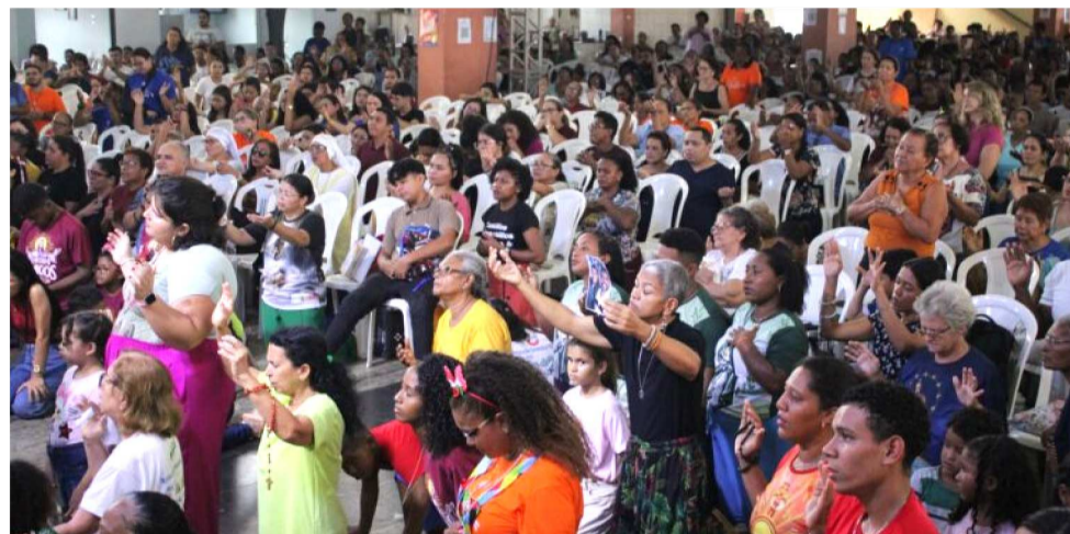
AO LONGO DOS TRÊS DIAS, OS PARTICIPANTES VIVENCIARÃO MOMENTOS DE LOUVOR

O Rebanhão chega à sua 35ª edição consolidado como parte do calendário carnavalesco do Maranhão, oferecendo uma alternativa cristã para quem deseja viver o período com es-