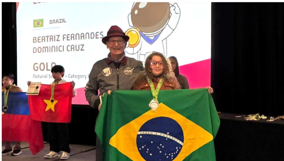
A OLIMPÍADA FOI REALIZADA NA RICE UNIVERSITY, NA CIDADE DE HOUSTON NO TEXAS

A Olimpíada foi realizada dos dias 21 a 26 de janeiro, na Rice University, na cidade de Houston no Texas, e teve como foco destacar os princípios da ciência natural, em uma realidade que cada vez mais converge para o desenvolvimento tecnológico. Além disso, o projeto busca desafiar os alunos a ressignificarem seus conhecimentos e pensarem como cientistas, expandindo sua curiosidade e aplicando a teoria aprendida em desafios do mundo