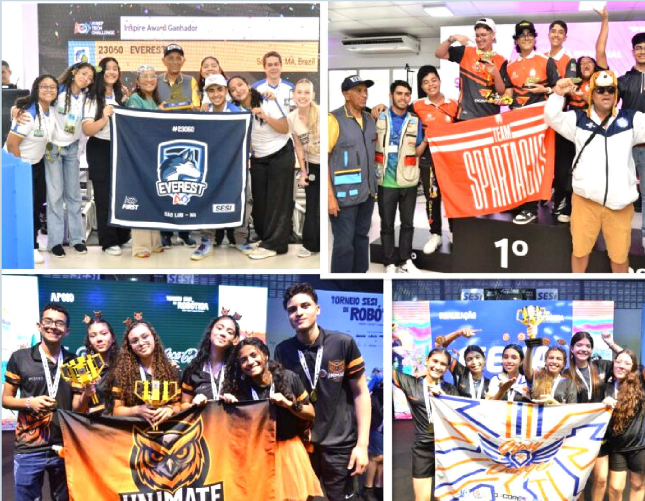
O Torneio SESI de Robótica é realizado pelo SESI-MA, entidade do Sistema FIEMA, e pelo SESI Departamento Nacional, com a correção do SEBRAE Maranhão, STEM Racing e First® Lego® League Challenge