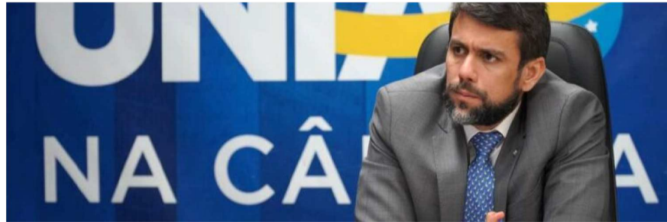
PDEPUTADO PEDRO LUCAS FERNANDES (UNIÃO-MA)

Será o segundo ano seguido em que o União Brasil terá o comando da CCJ. No ano passado, o colegiado foi presidido por Paulo Azi (União-BA). A manutenção da sigla na presidência foi firmada após acordo entre líderes.