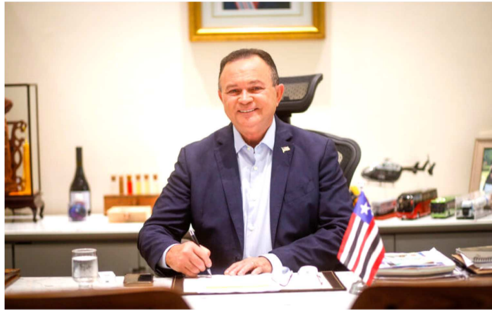
MEDIDA FAZ PARTE DE UM CONJUNTO DE AÇÕES DO GOVERNO BRANDÃO

“Temos investido muito na educação do Maranhão, fizemos o reajuste, reformamos mais de 700 escolas, demos cumprimento ao pagamento do Fundef, Prêmio Escola Digna e, agora, ao Programa Tô Conectado, que vai distribuir 30 mil chromebooks para fortalecer o trabalho dos professores e conectar todas as escolas. Essa é a nossa forma de valorizar quem dedica a vida ao ensino dos nossos estudantes”, frisou o governador Carlos Brandão.