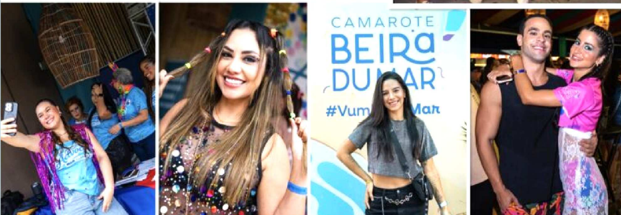
Uma noite memorável, de muita gente bonita, sorrisos, reencontros e a advocacia maranhense celebrando seu Bloquinho da OAB no Camarote Beira du Mar