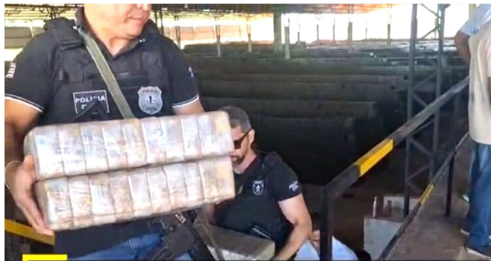
A DROGA FOI APREENDIDA NA ÚLTIMA SEXTA DURANTE UMA ABORDAGEM DA PRF

O caso também marca o início oficial dos trabalhos da Delegacia de Re-