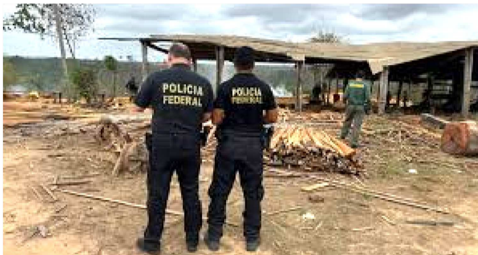
TODO O MATERIAL RECOLHIDO FOI DESTINADO A ÓRGÃOS PÚBLICOS PARCEIROS

Todo o material recolhido foi destinado a órgãos públicos parceiros, se-