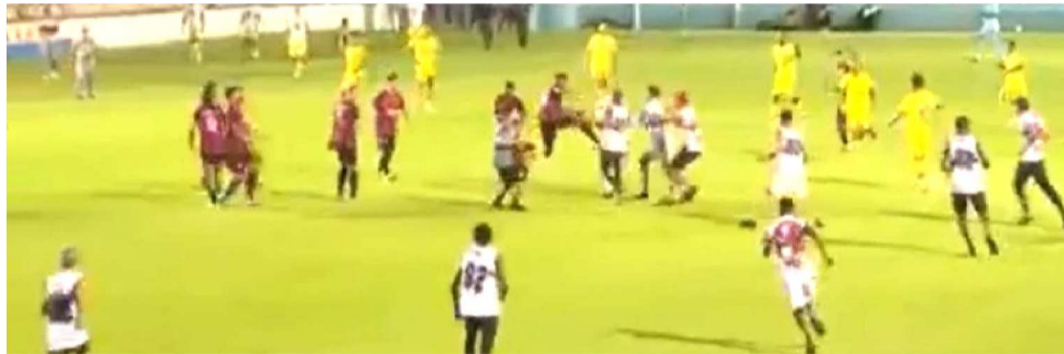
A PARTIDA FOI SUSPENSA APÓS UMA INVASÃO DA TORCIDA NO GRAMADO

“O clube faz o que sempre fez durante a competição, ou seja, pediu o