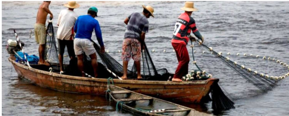
DECISÃO FUNDAMENTA-SE EM INVESTIGAÇÕES CONDUZIDAS PELA POLÍCIA FEDERAL

profissionais afetados foram notificados e tiveram um prazo de 30 dias para apresentar recursos administrativos. Diante da ausência de manifestação dos interessados no período estabelecido, as anulações foram confirmadas.