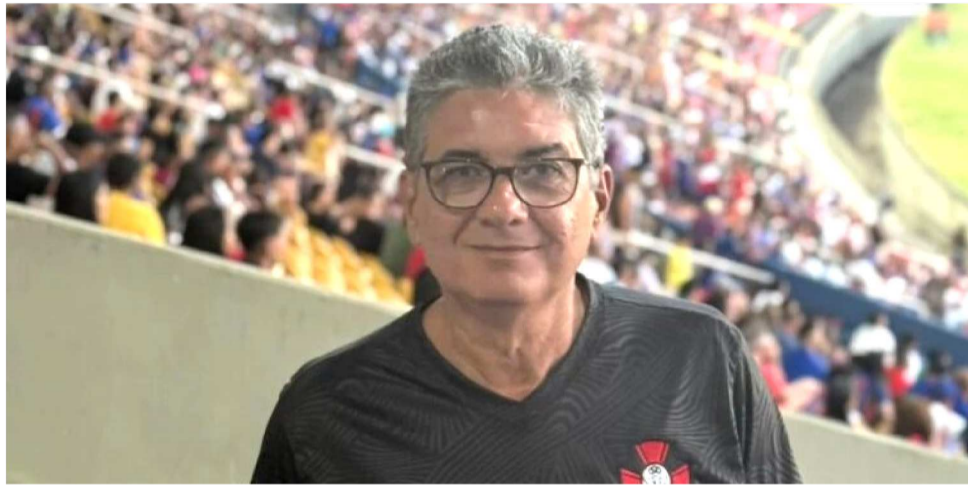
PRESIDENTE PEDIU À FMF UM RELATÓRIO COMPLETO DE TODAS AS TAXAS

Cópias integrais dos borderôs de todas as partidas disputadas pelo Moto Club de São Luís em competições oficiais organizadas ou supervisiona-