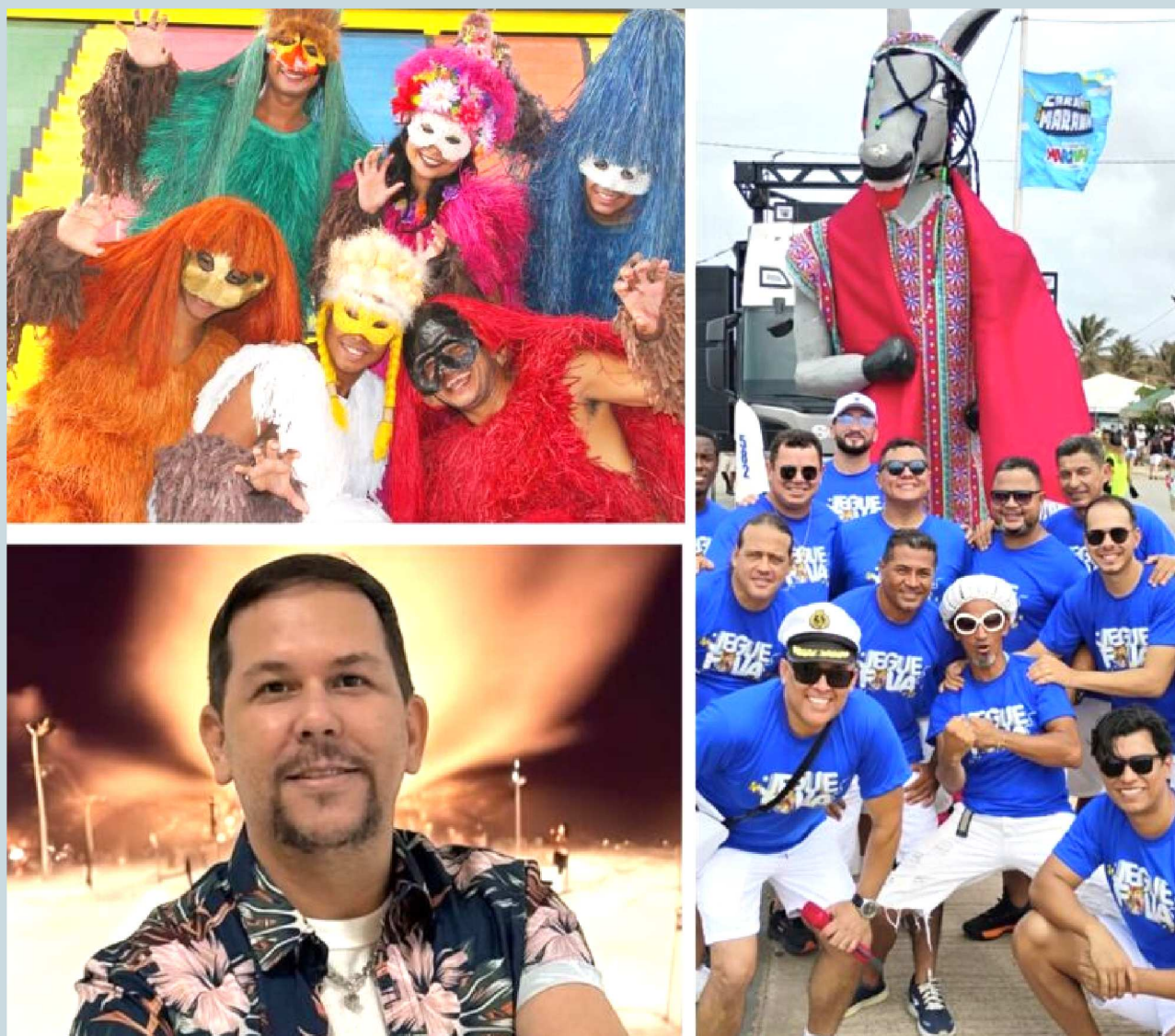
O Bicho Terra, da Companhia Barrica, o Bloco Jegue Folia (do Maranhão Novo) e a banda Kizoeira são destaques da programação do SESI Folia neste sábado (14), em São Luís