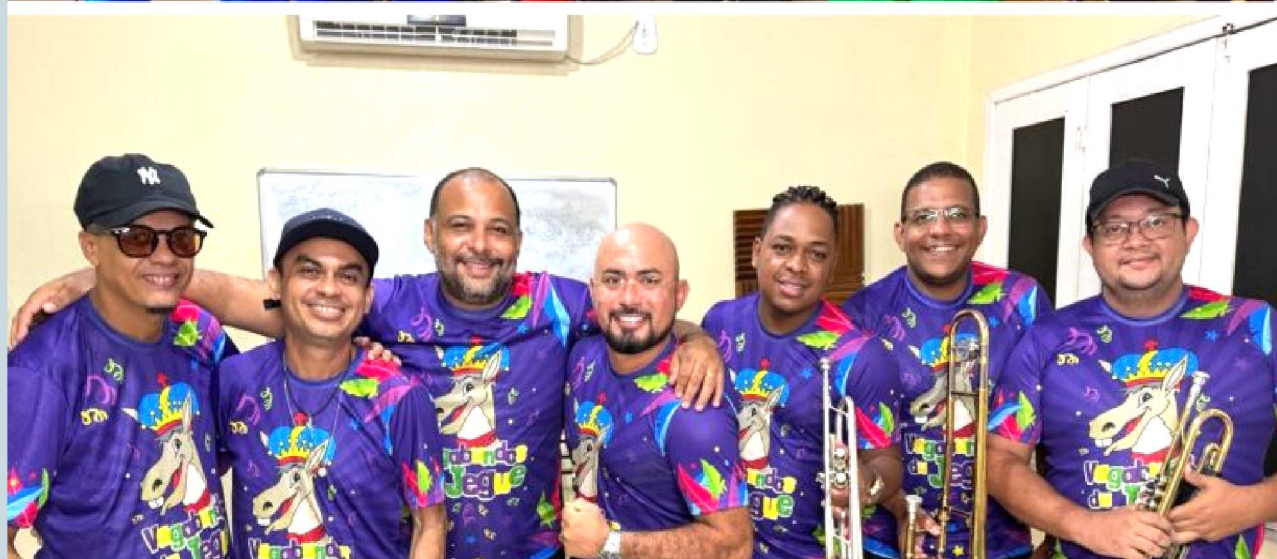
A banda infantil Unidunitê e o grupo Vagabundos do Jegue também vão animar a grande festa