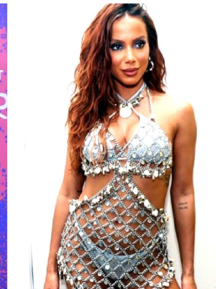
Neste sábado, no circuito "Vem Pro Mar", entre as atrações Claudia Leitte e Anitta