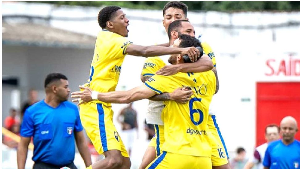
O IAPE RETORNA À COPA DO BRASIL APÓS 14 ANOS QUANDO ENFRENTOU O GALO EM 2011