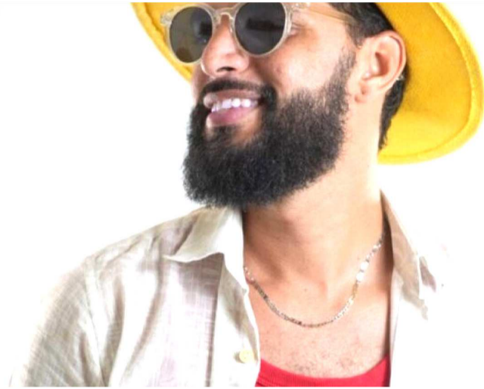
PROJETO CHEGA AO CIRCUITO COMO UMA DAS APOSTAS DA MÚSICA MARANHENSE

Criado como parte da carreira solo do artista, ex-vocalista da banda Filtro