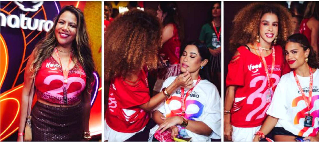
Espaço de autocuidado, e penteados e maquiagem no camarote recebeu personalidades que fizeram retoques e produções para encarar a maratona da folia em Salvador_