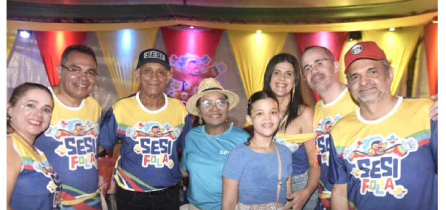
Entre as atrações, o bailinho infantil contou com desfile de fantasias, presença de personagens e apresentação da banda Unidunitê em ritmo camavalesco. À noite, subiram ao palco Jegue Folia, Kizoeira, Vagabundos do Jegue e Bicho Terra