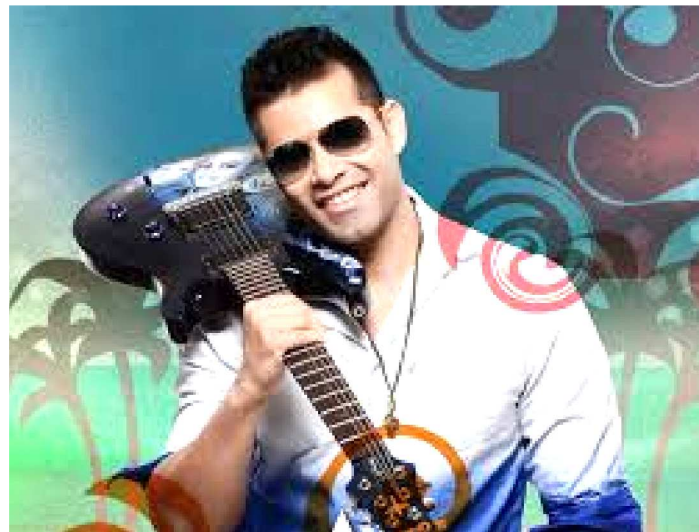
Chicanana também vai agitar o folião

Mais do que entretenimento, o Lava-Pratos é considerado um símbolo da identidade cultural ribamarense. A tradição, que atravessa oito décadas, mantém viva a celebração coletiva após o Carnaval e se consolidou como um dos eventos mais aguardados do calendário local. Segundo a Prefeitura, a proposta é unir música, gastronomia e lazer em um ambiente seguro, organizado e preparado para receber famílias e turistas.