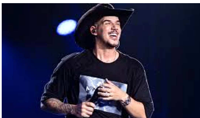
Zé Vaqueiro é uma das atrações do Lava-Pratos deste ano

Mais do que entretenimento, o Lava-Pratos é considerado um símbolo da identidade cultural ribamarense. A tradição, que atravessa oito décadas, mantém viva a celebração coletiva após o Carnaval e se consolidou como um dos eventos mais aguardados do calendário local. Segundo a Prefeitura, a proposta é unir música, gastronomia e lazer em um ambiente seguro, organizado e preparado para receber famílias e turistas.