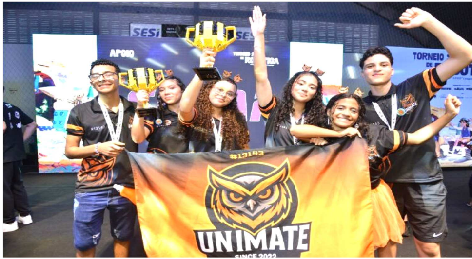
A UNIMATE CRIOU UM SISTEMA QUE REDUZ IMPACTOS, CONTROLA TEMPERATURA

Na competição, promovida pelo Serviço Social da Indústria (SESI), o desenvolvimento das soluções inovadoras integra a nota das equipes e tem tanto peso quanto o desempenho dos robôs de LEGO com os quais os alunos disputam no evento. As equipes são avaliadas pela capacidade de transformar conhecimento em propostas viáveis, com potencial de im-