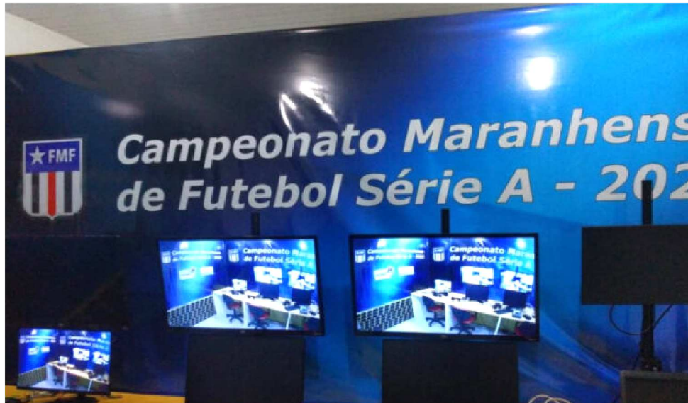
A INTENÇÃO DE TRAZER O VAR É EVITAR QUE LANCES DUVIDOSOS NA PARTIDA FINAL

A FMF respondeu imediatamente ao dirigente maqueano, garantindo que providências estão sendo tomadas e até já haviam sido tentadas para o primeiro jogo, mas não houve tempo suficiente para o pedido ser aten-