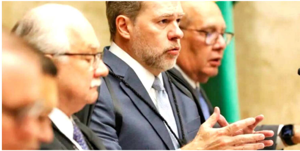
MINISTRO JÁ HAVIA DEIXADO A RELATORIA DAS INVESTIGAÇÕES

nistro Dias Toffoli foi alvo de críticas por ter permanecido nessa posição após matérias jornalísticas informarem que a Polícia Federal havia encontrado irregularidades em um fundo de investimento ligado ao Banco Master que comprou uma participação no resort Tayayá. Localizado no Paraná, o resort era de propriedade de