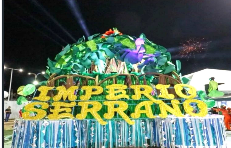
A ESCOLA DESFILOU DESFILOU NA ÚLTIMA SEXTA-FEIRA (20)

A programação reuniu apresentações de tambor de crioula, blocos organizados, blocos tradicionais dos grupos A e B e escolas de samba da capital.