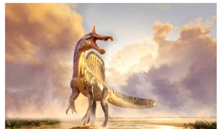
O Spinosaurus mirabilis foi descoberto no deserto o Saara

Esses dados permitiram que os cientistas criassem uma base de comparação mais abrangente, essencial para compreender a história evolutiva e a distribuição dos dinossauros do grupo ‘Spinosaurus’.