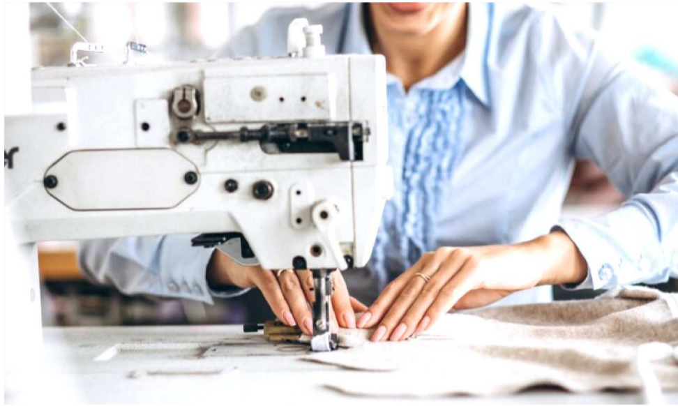
O CURSO POSSUI CARGA HORÁRIA DE 340 HORAS, COM INÍCIO NO DIA 16 DE MARÇO

As inscrições devem ser realizadas até o dia 6 de março, no SENAI Monte Castelo, na Avenida Getúlio Vargas, das 8h às 12h e das 13h às 17h. O crité-