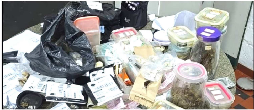
APÓS MONITORAMENTO, AS EQUIPES LOCALIZARAM O SUSPEITO NO SÃO FRANCISCO

A variedade e a quantidade de drogas chamaram a atenção dos investi-