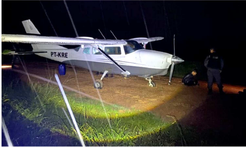
DRUGA SAIU DA BOLÍVIA E TINHA COMO DESTINO A CAPITAL MARRANHENSE SÃO LUÍS

Os dois homens que estavam na aeronave relataram que saíram da Bolívia, da cidade de Trinidad, no estado de Beni, e que inicialmente pousariam na região de Pinheiro, na Baixada Maranhense. Posteriormente, a droga seria transportada para São Luís. No