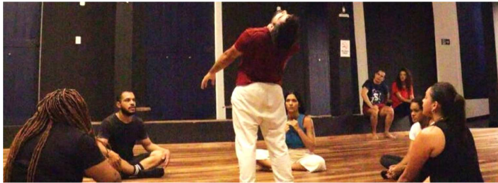
CANDIDATOS CLASSIFICADOS PARA VAGAS IMEDIATAS PARTICIPARÃO DE AUDIÇÕES

As audições e entrevistas ocorrerão entre os dias 9 e 18 de março de 2026 e serão destinadas apenas aos candidatos classificados para vaga imediata. A avaliação